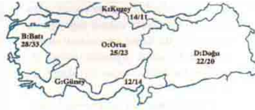
Devlet İstatistik Enstitüsü'nün demografik bölgelerine göre nüfusun dağılımı, 1960/1990 yüzdesi

Doğurganlık ve ölümlülük kadar önemli olan bir başka konu da göçtür. Türkiye'de Cumhuriyet'in başlangıcından 1950'lere kadar nüfusun doğal artışı (doğumlar eksi ölümler) çoğunlukla olduğu yerde kalmıştır. Kırsal alanlarda tarım devamlı olarak genişlemekte olduğundan kent alanlarına küçük çaplı göç