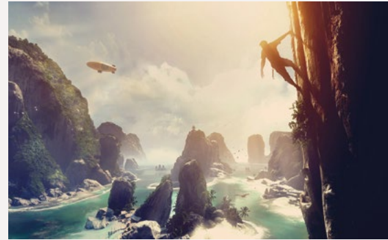
Crytek'in sanal gerçeklik için tasarladığı yeni oyunu Climb, yüzlerce metrelik tırmanışları evinizin rahatlığında yapmanıza olanak sağlayacak.

dek Crysis serisi başta olmak üzere görsel gerçeklikte sınırları zorlayan pek çok yapıma imza atan Crytek, The Climb ile sanal gerçeklik gözlükleri için gerçeğe yakın bir tırmanma hissi sunmayı vaat ediyor. Böylece muhteşem manzaralar eşliğinde kendinizi dik ya-