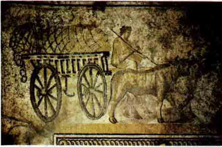
İsviçre'deki Orbe villasından bir mozaik. Eski evlerde süslemeye büyük önem verilmekteydi; Toprak duvarlı mütevazı villalarda bile duvar resimleri bulunuyordu.

kadastro durumu özellikle açığa kavuşturulmuştur; çünkü şehrin "zafer takı"nda bu kadastro yer almaktadır. Aynı bölgede bazı topraklar da yerlere verilmiştir. Villaların, ovaların iyi topraklarında kurulduğu, yerli köylerinin ise özellikle çok rutubetli vadilerde bulunduğu gözlenmektedir. Bununla birlikte, yerli Gal aristokratlarına ait villalar da mevcuttur.