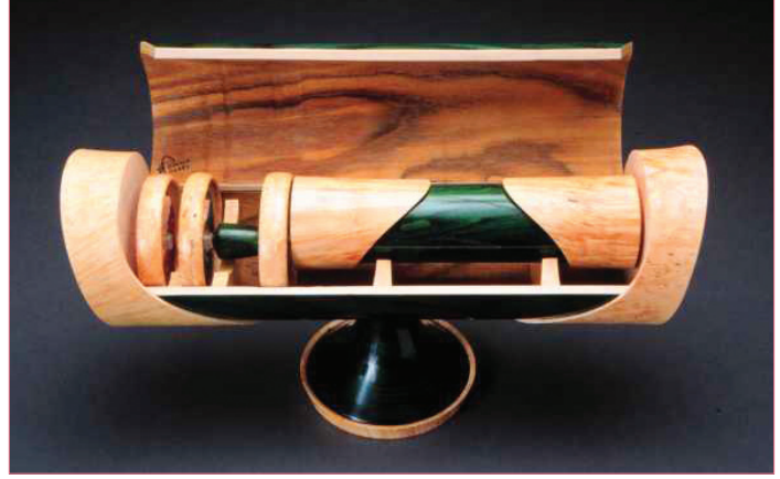
Kaleydeskop 80 yıldır sanatçılar ve biliminsanları tarafından bilinir.

Herşey Atılım Üniversitesi Bilgisayar Topluluğu başkanı Seda Çaman'ın "Bahar şenliğinde Atatürk Çocuk Yuvası'nda yaşayan çocuklar yararına ne yapalım?" sorusuyla başladı. Bu sayıda kaleydeskop anlatılacaktı ve yapım aşamalarının fotoğraflarının çekilmesi gerekiyordu. "Kaleydeskop yapın satın" dediğimde Seda'nın bakışlarından daha önce hiç kaleydeskop görmediğini anlamıştım. Hemen 40 cm uzunluğundaki kaleydeskobumu çıkardım ve "Göz göze bakabilir miyiz?" diye sordum. Binlerce göz Seda'yı ikna etmeye yetmişti. Sonra bir tereddüt yaşadığını farkettim. "Sadece 3 ayndan oluşan bir optik oyuncak arkadaşlarıma basit gelebilir mi acaba diye düşündüm" dedi. Ona kaleydeskobun 80 yıldır sanatçılar ve biliminsanları tarafından bilindiğini, yansıma ve simetrinin oluşturduğu görsel şölenin grafik, bilgisayarlara ekran koruyucu tasarlanması, sahne ışıklandırılmasında vb. kullanıldığını söyledim; hatta dantel, yastık ve bere motiflerine bile ilham verdiğini, Seda ve arkadaşları çok sayıda kaleydeskop yaptılar ve çok eğlendiler. Siz de kendinize mutlaka bir kaleydeskop yapın. Okulunuzun bahçesine, içine girebileceğiniz kadar büyük bir kaleydeskop yapmasını sağlayın.