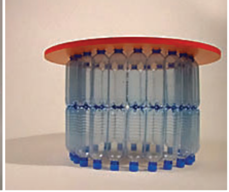
Doğada yok olmaları yüzlerce yıl alan pet şişeler bu tür tasarımlarda kullanılabilir.

Yeniden düşün + yeniden kullan tasarım yarışmalarındaki yaratıcı çözümlerin sınırsızlığı konusunda bilgi vermek amacıyla örneklerimize bu sayıda da devam ediyoruz. İlk örnek çok basit bir çözümlerle pet şişelerden çok kullanışlı ev eşyası yapımını içeriyor.