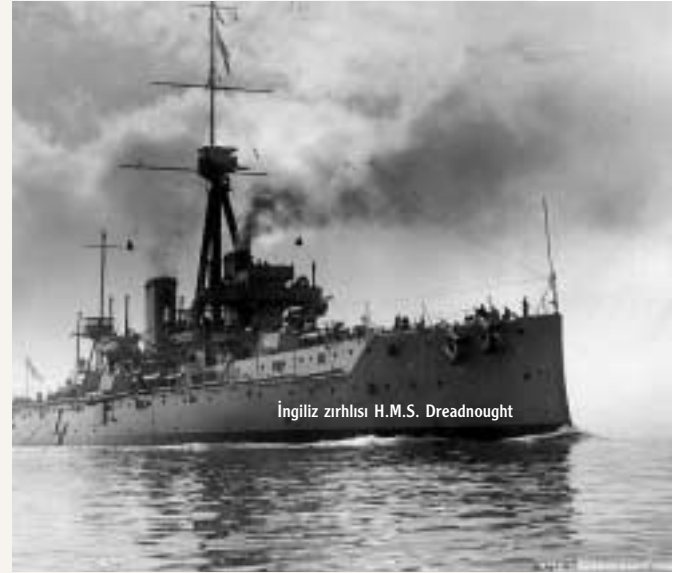
İngiliz zirhlısı H.M.S. Dreadnought

Avrupa devletlerinden en hızlı savaş gemilerine sahip olanlar aşağıdaki gibidir: saatte en azından on yedi mil yol alabilecek gemilerden olmak üzere halen İngiltere devleti 160, Fransa 145, İtalya 121, Almanya 101, Avusturya-Macaristan 42 ve Rusya 32 hızlı gemiye sahiptir.