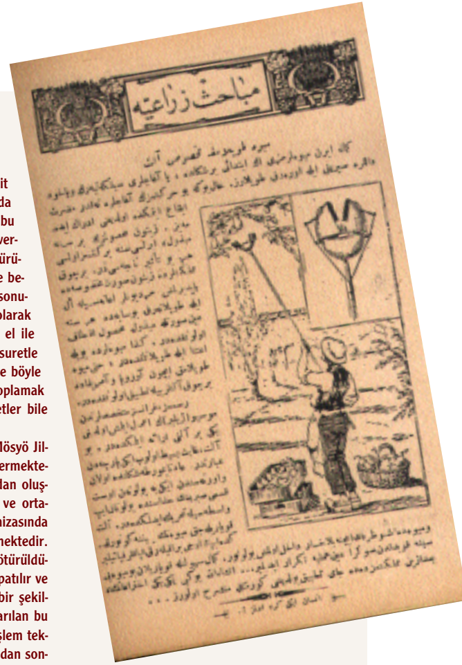
Millî Nevsal, 1924, s.366.

Resmimiz, Fransız uzmanlarından Mös-yö Jilber'in yapmış olduğu yeni bir âleti göstermektedir. Bu âlet gayet basit olup iki parçadan oluşmaktadır. detâ yumurta şeklinde olan ve ortasından ikiye bölünen üst kısmı sırım hizasında bulunan ip aracılığıyla harekete geçirilmektedir. let, koparılacak meyvenin yakınına götürüldüğünde ipin ucu bırakılarak kapaklar kapatılır ve meyve bu koruyucunun içine hasarsız bir şekilde girmiş olur. Tam bir nezaketle koparılan bu meyveyi sepete koyduktan sonra aynı işlem tekrar edilir...İnşallah bu gibi icâtların bundan sonra memleketimizde de uygulandığını görmekte içimiz rahat oluruz.