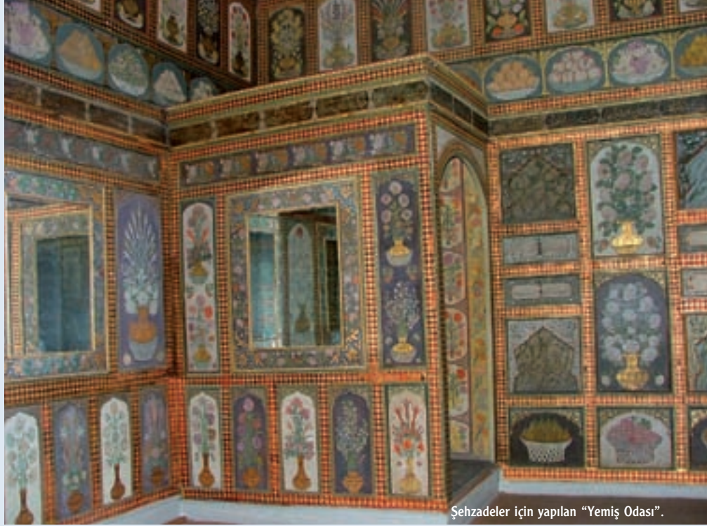
Şehzadeler için yapılan “Yemiş Odası”.

Son günlerde “küratör” sözcüğünü sıkça duyuyoruz. Bir kısmımız için çok yabancı bir sözcük; ne anlama geldiğini bile bilmiyoruz. Bir kısmımızsa, küratörlerin işinin yalnızca sergi yapmak olduğunu düşünüyoruz. Oysa küratörlerin, arşiv uzmanlarının ve teknisyenlerin yaptıkları işler çok çeşitli ve fazla. Temel görevleri, önemli belgeleri ve değerli nesnelere toplamak, saklamak ve sergilemek olan küratör ve arşiv uzmanları, sanıldığı gibi yalnızca müzelerde çalışmıyorlar. Hayvanat bahçelerinden üniversitelere, botanik bahçelerinden deniz müzelerine ve doğa tarihi müzelerine kadar birçok değişik kurum ve kuruluşta görev yapabiliyorlar. Bu kurumlarda, toplum yararını göz önünde bulundurarak değerli belge ve nesnelerin tanımlanması, kataloglanması, analizi, sergilenmesi, korunması ve derlenmesi gibi işler yapıyorlar. Bu çalışmaların konuları, her türden sanat eseri, yazmalar, önemli toplantı tutanakları, madeni paralar, pullar, endemik bitkiler, soyu tükenmekte olan hayvanlar, tarihi eserler, binalar hatta kentler bile olabilir. Küratörler turlar, çalıştaylar, kurslar gibi halka yönelik eğitim ve rehberlik hizmetleri düzenleyebiliyor, enstitülerin yönetim planlarını ve politikalarını oluşturmada yönetim kurullarına