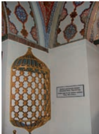
Padişahın divan toplantılarını arkasından izlediği kafes.

İ.O.- Ben çok önem veriyorum bu küratörlüğe. O nedenle küratör sayısının artırılması gerektiğini düşünüyorum, buna gayret ediyoruz. Bu kişilerin Osmanlı uzmanı olması, Osmanlıca bilmesi lazım. Bütün dünya bu küratörlerin sahalarında eser vermesini, makale yazmasını, araştırma yapmasını bekliyor. Bunu yapanlar olduğu gibi, yapmayanlar da var tabii. Burada çalışmak, küratör olmak büyük bir imtiyazdır. Ancak, Kültür Bakanlığı aşağı yukarı 14 senedir hiç uzman yarımcısı almamış müzelerle. Şimdi yeni yeni eleman alınmaya başlanıyor. Eğer böyle kadrolar açılmazsa, adam alınmazsa nasıl yaşar ki mües-seseler?