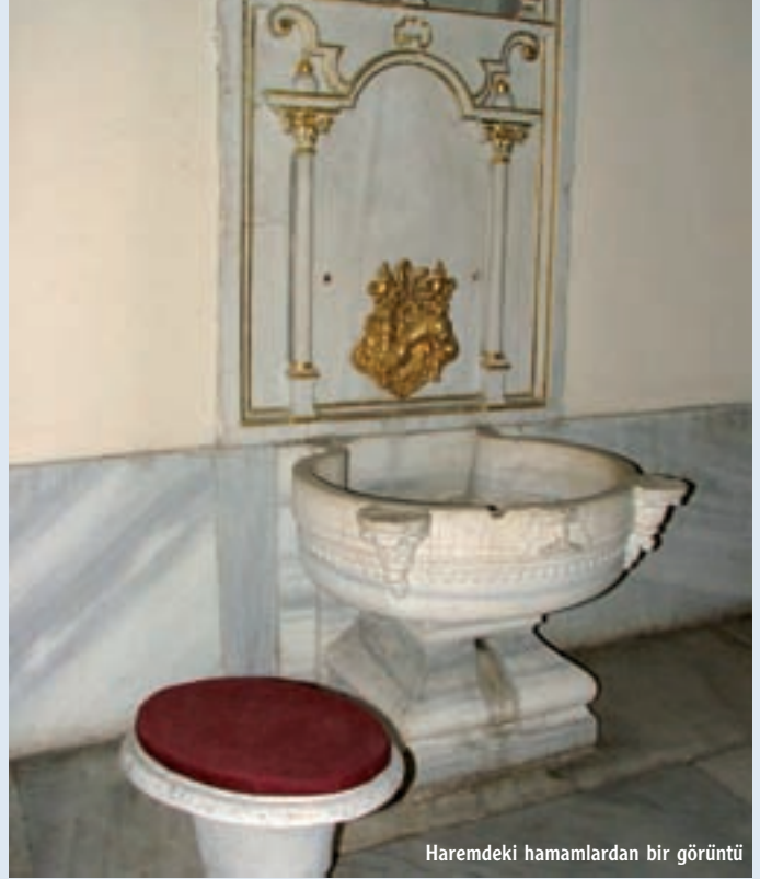
Haremdeki hamamlardan bir görüntü

kim konuların işlendiği çalıştaylar, edebiyat ve görsel sanatlar arasında bağ kurmayı amaçlayan hikâye anlatımları, rehberlik hizmetleri, çocuklara yönelik bilgilendirme kursları, oyunlar, drama çalışmaları gibi birçok etkinlik de ziyaretçilerin beğenisine sunuluyor. Bunların yanı sıra, profesyonellere yönelik eğitim ve seminerler de düzenleniyor. Kimi büyük müzelerde akademisyenler, sanatçılar, mimarlar, eğitimciler ve küratörler için eğitim programları açılıyor, katılımcılar bilgi ve deneyimlerini buralarda paylaşabiliyorlar. Ayrıca birçok satsal etkinliğin başlatıcısı ve koruyucusu olan müzeler de var. Örneğin, Rusya'nın en eski tiyatrolarından biri olan Hermitage Müze Tiyatrosu, 200 yıldan uzun bir süredir etkinliklerini sürdürüyor. Tüm büyük müzelerde,