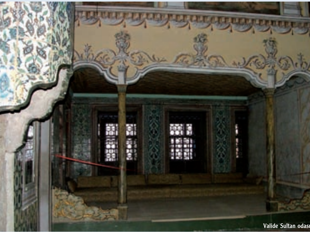
Valide Sultan odası

nümüze aktaran tek saray olma özelliğini koruyor.