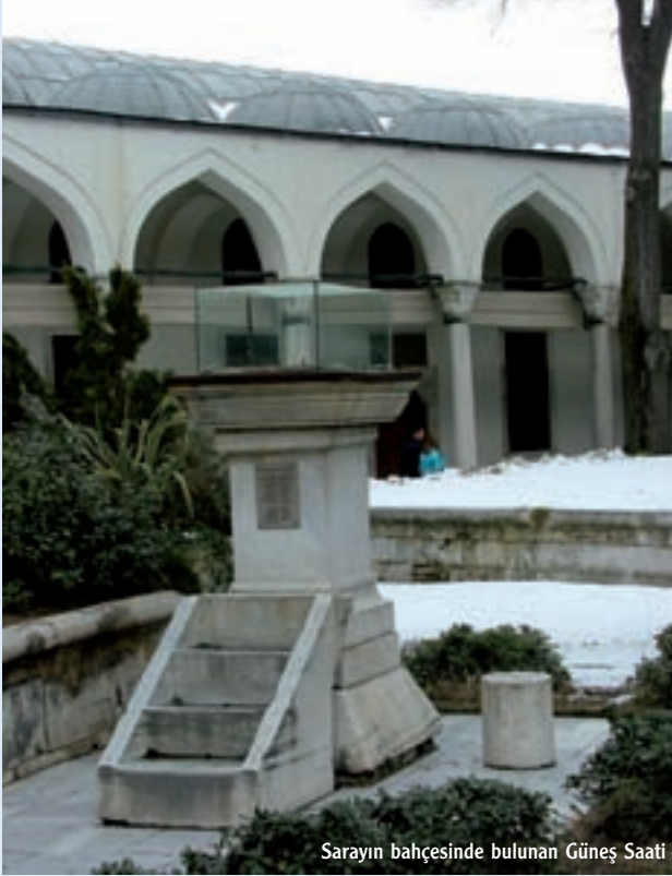
Sarayın bahçesinde bulunan Güneş Saati