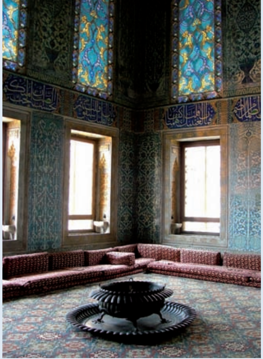
Topkapı Sarayı farklı dönemlerde eklenen yapılarla genişleşmiş. Revan Köşkü de bu yapılardan biri.

Dünyada günümüze gelebilmiş sarayların en eski ve genişlerinden biri Topkapı Sarayı. Topkapı, Atatürk'ün emri ile 1924 yılından beri müze olarak kullanılıyor. Konumu Haliç'i, Boğaziçi'ni ve Marmara denizi gören, tarihi yarımada olarak adlandırılan bölgede. İstanbul'un ilk kuruluş yeri olarak bilinen akropol tepesi. Tarihi İstanbul üçgen yarımadasının en uç noktasında, adını verdiği Sarayburnu'nda 5 km'yi bulan surlarla çevrili, 700.000 m 2 özel araziye sahip bir kompleks. İstanbul'un fethini 1453'te gerçekleştiren genç Fatih Sultan Mehmet, İmparatorluk tahtını bu şehre taşıdı. Kurduğu ilk saray şehrin ortasında bulunuyordu. Fetihden sonra inşa edilen bu ilk saray, bugünkü İstanbul Üniversitesi merkez binasının olduğu yerdedi. Fatih, daha sonra İstanbul'a hakim ve eski dönem binalarının hepsinden üstün görünümde yeni bir saray yapılmasını istemiş ve saray inşa edilmişti. 1475-1478 yılları arasında yapılan bu ikinci saraya, önceleri yeni saray, sonraları da Topkapı Sarayı denildi. Burası, tarihte bilinen diğerleri gibi, klasik bir Türk sarayıydı. Değişik işlevleri olan, ağaçlarla gölgelendirilmiş, birbirini izleyen ve görkemli kapılarla ayrılmış avlulardan oluşuyor. İşlevsel yapılar bu avluların çevresine serpiştirilmiş. Saray, kurulduğu çağdan başlayarak Sultanların yaptırdığı birçok değişiklik ve eklemelerle sürekli gelişmişti. Tarih boyunca farklı dönemlerde yapılan eklemelerle genişleyen saray, kimi zaman da yangınlar, depremler ve yıkımlarla çehre değiştirdi. Son yıkım