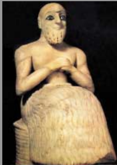
Mari kentinde bulunan oturan adam heykeli.

des ile diğer klasik kaynaklarda Ahameniş adlarının kullanımının yardımıyla Persçe uyarlamasının büyük bölümünü çözmeyi başardı. Sonraki yıllarda çok sayıda bilim adamı tarafından eklemeler ve düzeltmeler yapıldı. Ancak bu konuda en büyük başarı İngiliz H. C. Rawlinson'a aittir. İngiliz istihbarat örgütünün bir üyesi olan Rawlinson'un ilk durağı Pers dili üzerine araştırma yaptığı Hindistan'dı. 1835'te İran'a gön-