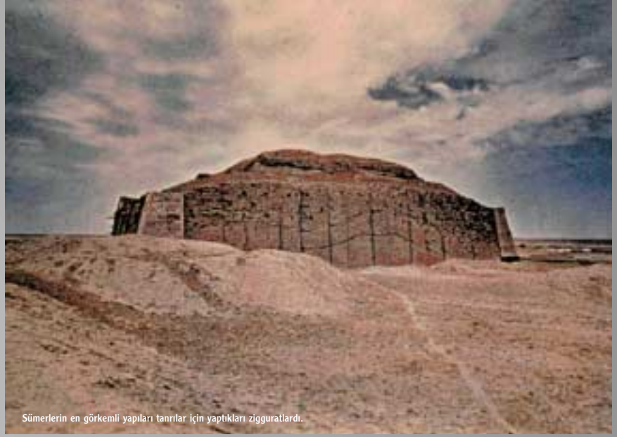
Sümerlerin en görkemli yapıları tanrılar için yaptıkları zigguratlardı.

İlkel siteler kısa sürede devlet biçiminde örgütlenmekte gecikmezler. İktidarın kullanılması başlıca iki gücü: savaş önderiyle başrahibi karşı karşıya getiren çekişmelere yol açar; din ağır-