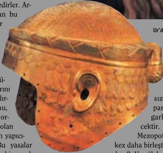
Ur'daki kraliyet mezarından çıkarılan Kral Meskalamduğ'un miğferi (solda). Ur'daki kazılarda bulunan süslemeli boğa başı (üste).

Bir süre sonra Mari kenti de neredeyse tam bağımsızlık içinde parlak bir uygarlık geliştirecektir.