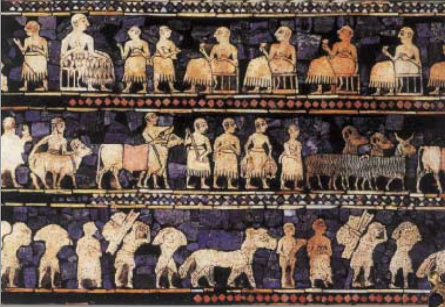
Ur'daki kraliyet mezarında bulunan bu resimde askerler, çiftçiler, müzisyenler gibi halkın değişik kesimlerinden insanlar görülüyor. (Üstte) Altın ve lapis lazuliden yapılmış aslan başlı şahin figürü (sağda).

lim adamlarının yararlanabileceği Kitabı Mukaddes gibi klasik ve post-klasik birçok kaynak vardır. Yalnızca Mısır, Asur, Babil gibi adların bilinmesinden değil, aynı zamanda halkların kültürünün de bütünüyle bilinmez olmayışından. Buna karşın Sümerler hakkında durum oldukça farklıydı. Bilinen kayıtların hiçbiri Sümerlerden söz etmiyordu. Bu anlamda Sümer dilinin çözülmesi, oldukça önemli bir keşifti.