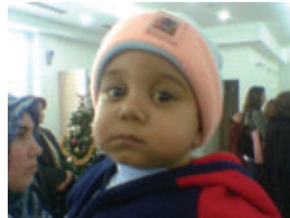
Doğuştan safra yolu yokluğu nedeniyle sarılık geçirmiş olan bu çocuk karaciğer nakli sayesinde kurtuldu.

Öncelikle büyük bir önyargıdan kurtulmuş olduk. Kadavra organlarının sayısını artırmaya yönelik çalışmalar başlamadan önce bu konuda eksiki-