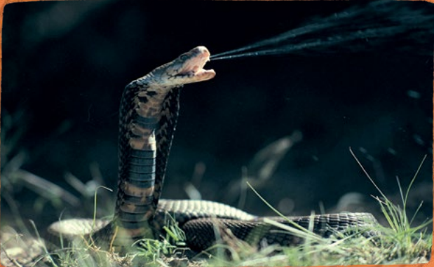
Mozambik tüküren kobrası, tehdit altındayken zehir püskürtüyor.

sıkıştığında baş bölgesindeki kan basıncını artırarak gözlerinden kan fıskırmasını ve avcının şaşırmasını sağlar. Böylece kertenkele kendisini avlamak üzere olan avcısından kurtulabilir.