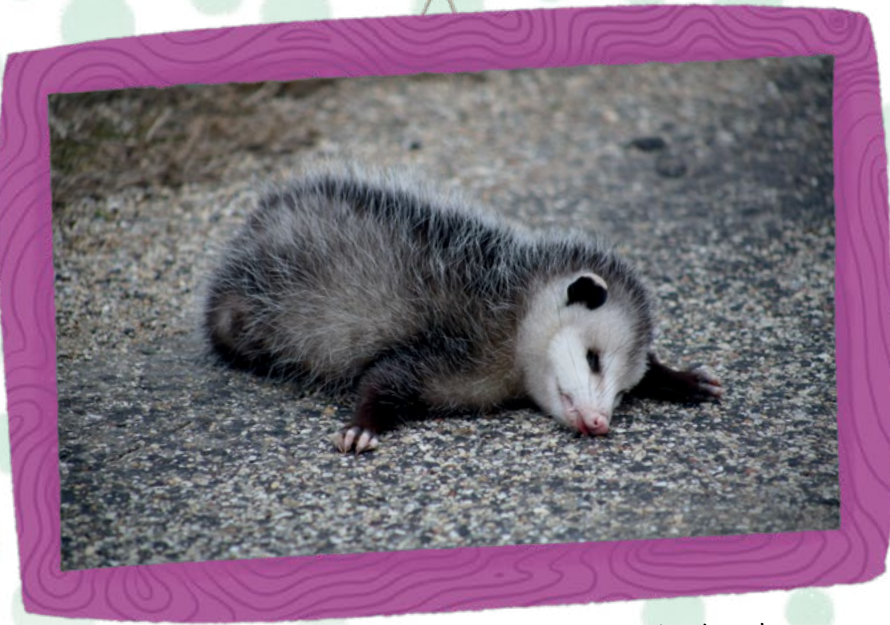
Hareketsiz kalarak avcısını yanıltmaya çalışan bir keseli sıçan

Keseli sıçan, korktuğunda dişlerini gösterir ve tıslar. Avcısıyla karşılaştığında genellikle ağaçlara ya da çalılara saklanır. Köşeye sıkıştıyındaysa avcısını yanıltmaya çalışır ve bir heykel gibi donar. Sonrasında kendisini yere bırakarak hareketsiz kalır. Bu sırada ağzını açıp dilini dışarı çıkarır ve kalın bağırsağından dışarı kötü kokulu bir sıvı salgılar. Böylece avcısı keseli sıçanın artık yaşamadığını düşünür ve oradan uzaklaşır.