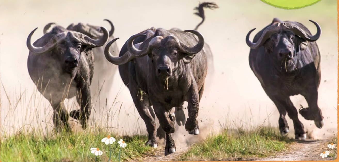
Saldırı hâlindeki Afrika mandaları

Gruplar hâlinde yaşayan bazı hayvanlar tek başlarıyken yapamayacakları şeyi grubun kalabalıklığına güvenerek yapabilir. Örneğin Afrika mandaları, en tehlikeli avcıları olan aslanlara birlikte saldırır.