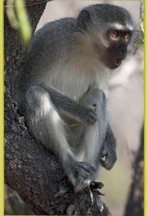
Alarm çağrısı yapan bir vervet maymunu

Hayvanların kendilerini savunmak için kullandığı bir diğer yöntemse alarm çağrısı yapmaktır. Örneğin vervet maymunları; leopar, kartal ya da yılan gibi farklı avcılar için farklı alarm çağrıları verir. Bunu duyan diğer vervet maymunları verilen çağrının içeriğine göre bir savunma pozisyonu alır. Leopar çağrısı verildiyse ağaca koşar, kartal çağrısı verildiyse kuytulara saklanır, yılan çağrısı verildiyse de ayakları üzerinde durup yılan arayışına geçerler.