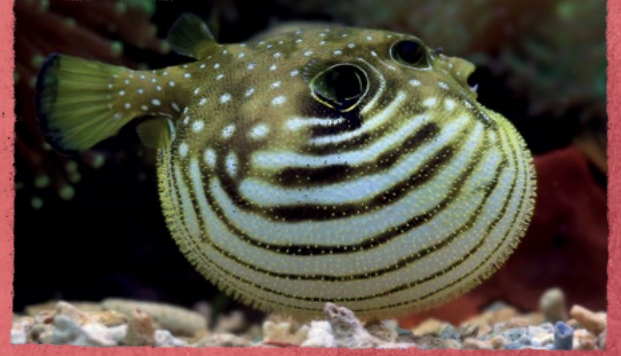
Balon balığının normal (üstte) ve kendini şişirmiş hâli (altta)

Tembel ayılar kendilerini olduğundan büyük göstermek için arka ayaklarının üzerinde durur.