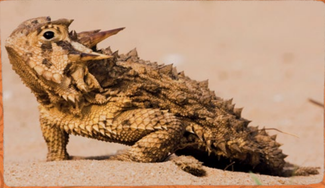
Teksas boynuzlu kertenkelesi