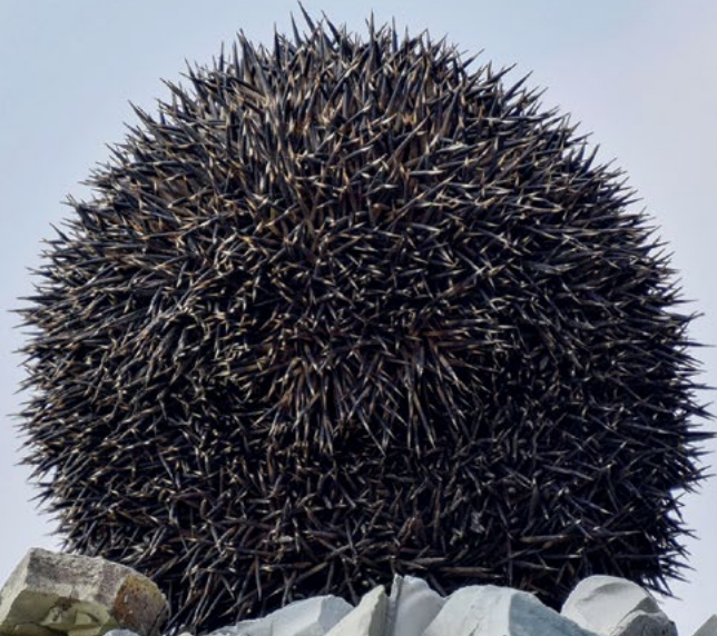
Kendini tehdit altında hisseden kirpi

Bahçenizde gezinirken rastladığınız kirpinin aniden yusuvarlak olduğunu ve dikenlerini çıkardığını ya da yavrularına yaklaşan canlıyı uzaklaştırmak için bir kedinin kuyruğunu ve gövdesini kabarttığını görmüş olabilirsiniz. Tehdit ya da tehlike altında olduğunu hisseden her hayvan, kendini savunmak için çeşitli yöntemler kullanır. Bu yöntemlerden bazılarıysa oldukça ilginç. Keşfe hazır mısınız?