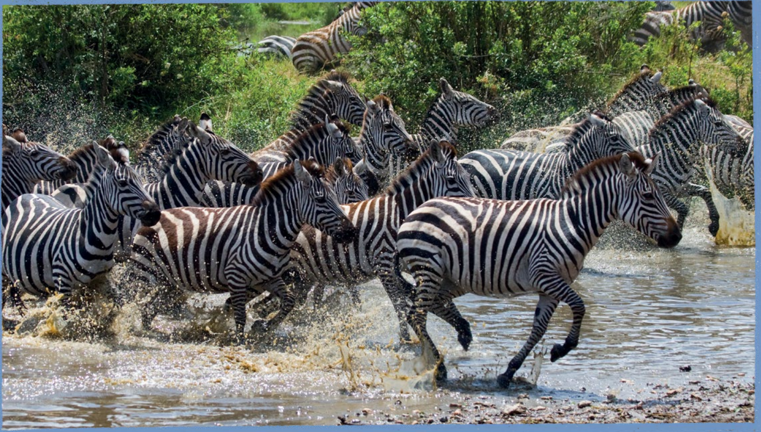
Avcıdan kaçan zebrealar

Bazı hayvanların gruplar hâlinde yaşaması da bir savunma yöntemidir. Tek bir ava odaklanmaya çalışan avcı, kalabalık bir grup karşısında bunu yapmakta zorlanır. Grup hareket ettikçe bu durum daha da güçleşir. Ayrıca çevreyi gözlemlemek için daha fazla sayıya sahip olmak da grup hâlinde yaşayan hayvanların yararınadır. Örneğin zebra tek başınayken hemen fark edilir ve kolay bir av olarak algılanır. Ancak bir grubun içinde yer alıyorsa gruptaki zebra sayısı, zebrenin av olmasını zorlaştırır.