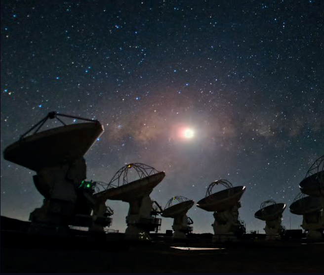
ALMA (Atacama Large Millimeter/submillimeter Array ) Radyo Teleskop Dizisi / NASA

Venüs'ün bulutlarındaki fosfin, ilk olarak, Hawaii'deki James Clerk Maxwell Teleskobu (JCMT) ile Haziran 2017'de yapılan gözlemlerin analizleri sonucunda ortaya çıkarılmıştı. Venüs'ün tayfında fosfin görülmesi araştırmacıları şaşırtmıştı. Ancak Avrupa Güney Gözlemevi'nin de (ESO) ortağı olduğu Şili'deki ALMA'nın (Atacama Large Millimeter/submillimeter Array) 45 radyo teleskobu kullanılarak Mart 2019'da yapılan gözlemlerle de keşif doğrulandı. Her iki gözlem de elektromanyetik tayfın radyo bölgesine karşılık gelen yaklaşık 1 mm dalga boyu civarında yapıldı. Tayfın 1,12 mm dalga boyunda görülen akı düşmesinin (bu dalgaboyundaki ışığın Venüs atmosferinden geçerken fosfin molekülü tarafından soğurulması), bulutlardaki fosfinden kaynaklandığı ortaya çıkarıldı.