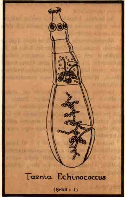
Larvasının insanda Kist hastalığı yapan Taenia'nın büyütülmüş şekli.

Yumurtalar, insanlardan başka bu otları yiyen hayvanların da hazım organlarına geçer. Bu hayvanlara "Ara konakçısı - Ara hayvanı" denir. Yumurtalar bu hayvanların ve insanların değişik organlarına giderek kist meydana getirirler. Kistli