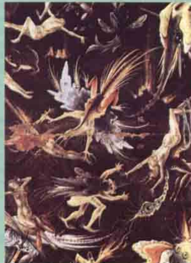
Görsel halüsinasyonlar sırasında görülen korkunç yaratıklar (H.Bosch'dan tablo).

21 yaşında fen fakültesi öğrencisi kız. 2 aydır okula gitmiyor; bütün gün odasında uyuyor. Çok az yemek yiyor ve çok az konuşuyor. Hiç yıkanmadığı ve çamaşır değişmediği için pis kokuyor ( Kokarca manevrası ). Amaç: Dünya'yı protesto. Elbiseleri buruşuk ve leke içinde. Saçını taramadığı için saçları karmakarışık. Arkadaşlarını aramıyor. Eve gelen konuklara nüfus ve evlenme cüzdanlarını soruyor. Bir gün "Dün demi mezara gömdük" diye kahkahalar atarak neşeli bir dans yapıyor ( duygu ve davranışlar arasında uyumsuzluk ). Bazen konukların ve ailesinin yanında mastürbasyon yapıyor ( toplumun değer yargılarını umursamazlık ). Kendisine engel olunmak istenince korkunç çığlıklar atıyor ve saldırganlaşıyor. Babasının şeytan, annesinin cadı olduğuna inanıyor.