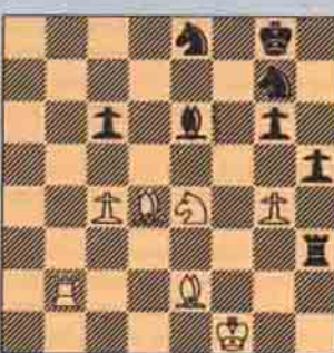
II. Sıra Beyaz'da