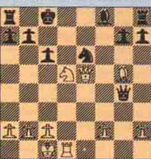
I. Sıra Beyaz'da