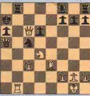
IV. Sıra Beyaz'da

1. Vc7+ Axc7 2. Ab6+ (1-0) Kd8 mat! II. 1. Kd8 Kd7 2. Ff7 2. Ab6+ S8 2. Ff3 mat! 1... Şf2 Kd8! (1-0) 14... Fxh8 5. Af7 mat! 1V. 1. Vc5? 1Vb6 1... Vc5? 2. Axc7+ ve 3. Kxh8 mat! 2. Axc7+ 2. Fxg7 Şa7 3. Kce8 ve bir başka konum. III. 1. Kf8+ Fd8 2. Vg5+ Fc7 3. Af8+ S18 4. Kf8! (1-0) 14... Fxh8 5. Af7 mat! 1V. 1. Vc5? 1Vb6 1... Vc5? 2. Axc7+ ve 3. Kxh8 mat! 2. Axc7+