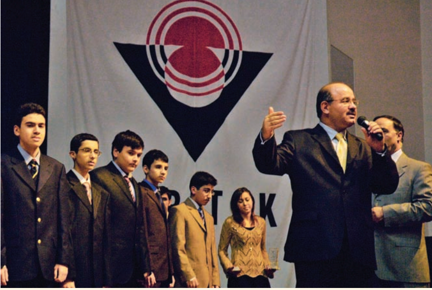
TÜBİTAK Bilim İnsanı Destekleme Daire Başkanlığı tarafından düzenlenen XIV. Ulusal Bilim Olimpiyatları ve XI. Ulusal İlköğretim Matematik Olimpiyatı'nda dereceye giren öğrenciler,

neği güçlü bir ülkenin dağılması sonucunda, yarışmalara Rusya ve Ukrayna gibi matematik geleneği güçlü iki ülke katılmaya başlamış.. Rusya'nın Sovyetler'in yerini fazlasıyla doldurup sürekli başa güreştiği görülüyor. Ancak, araya bir de Ukrayna gibi güçlü bir rakip girmiş oluyor. Sovyet geleneğinden Beyaz Rusya, Kazakistan, Moldova gibi matematiğin iyi olduğu ülkelerin yanında, 10 tane sürekli düşük dereceler alan ülke devreye girmiş. Yugoslavya'nın dağılması sonucunda ortaya çıkmış ülkeler de pek başarılı olamamışlar. Ayrıca, olimpiyat katılımcıları artarken, yeni katılanların genellikle kötü derece alan ülkeler olmaları, göreceli sıralamada Türkiye'yi yukarıya iten bir sonuç doğurmuş. Ancak, bütün bu zahiri nedenler, Türkiye'nin gösterdiği belirgin ilerlemeyi açıklamaya yeter gözüküyor. Diğer taraftan, yarışmalarda derece alabilmenin, hazırlık ve seçimleri doğru yapabilmenin de bir öğrenme süreci gerektirdiği düşünülürse, zamanla daha iyi seviyelere çıkmak için somut bir neden daha buluyoruz. Bu iki önemli neden derecemizi yukarı çekmeye katkıları olmuş. Ancak imo istatistiklerinin incelenmesi, Türkiye'deki matematik seviyesinin hızla yükseldiğini göstermese de, ters yönde bir sava da yol açmıyor. Ülkede matematik geleneği oluşturmak için süre giden çalışmaların net başarılar kazandığını gösteren bir kanıt yok.