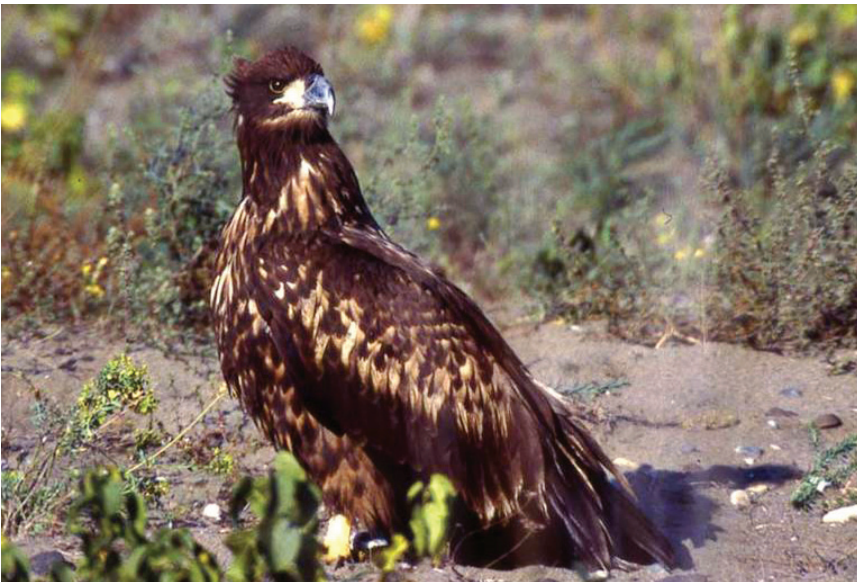
Akkuyruklu kartal ( Haliaeetus albicilla )

Kızılırmak Deltası bulunduğu bio-coğrafik bölge açısından, Batı palaerktik bölge içerisinde yer almaktadır. Bu bölge; Ural Dağları'ndan başlayarak Türkiye-İran sınırını takip ederek tüm Orta-doğu ve Arabistan yarımadasının bir kısmını, Kuzey Afrika'nın tamamını ve Kanarya Adaları dahil olmak üzere tüm Avrupa ve Faroe adalarıyla birlikte çok büyük bir alanı kapsamaktadır. Bu bölgede yaklaşık olarak 1100 kuş türü tespit edilmiştir. Türkiye'de ise 450 kuş türü tespit edilirken, yalnızca Kızılırmak Deltası'nda bu zamana kadar 323 kuş türü tespit edilmiştir. Bu kuş türlerinde yaklaşık olarak 140 türü deltada ürerken, dünyada nesli tehlike altında olan 24 tür yine Kızılırmak Deltası'nda yaşıyor. Özellikle kış dönemlerinde Kızılırmak Deltası'nda 100.000 kuşun kışladığı tespit edilirken, yalnızca bu kriter bile ala-