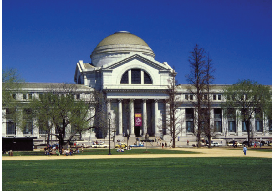
Smithsonian Enstitüsü Ulusal Doğa Tarihi Müzesi

Müzelerin amacı, tarihin eski dönemlerinde yaşamış bulunan medeniyetleri bilim ve sanat açısından inceleyerek, hem günümüze, hem de geleceği aydınlatmaktır. Ayrıca müzelerde sergilenen geçmişe ait eserlerle, ülkelerin ulusal değerlerinin oluşmasına önemli katkıda bulunurlar ve aynı zamanda etkin katılım ve kalıcı öğrenmeyi sağlayan eğitim kurumlarıdır.