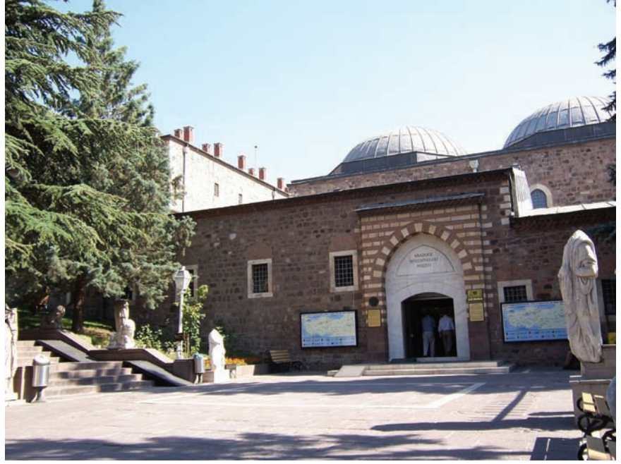
Ankara Anadolu Medeniyetleri Müzesi

Günümüzde müzeler bir değişim sürecine girmiştir. Artık önemli olan bilginin geniş kapsamıyla kullanılması. Buna göre müzeleri üç sınıfa ayırabiliriz. Bunlar nesne odaklı, nesne odaklı bilgiye yönelen ve bilgi odaklı olup nesneye yönelen müzeler. Nesne odaklı müzeler, 15. yüzyılda başlayan koleksiyonculuk geleneğinin bir uzantısı. Burada yalnızca nesnelere depolanır, etiketlenir ve göstermek dışında bir başka amacı da yoktur. Bilgi yalnızca biriktirilir ve dağıtım işlemi yapılmaz. Dolayısıyla bilginin dağıtılması kısıtlıdır, nesneye odaklıdır ve müzenin eğitim aracı olarak kullanılmasından uzaktır.