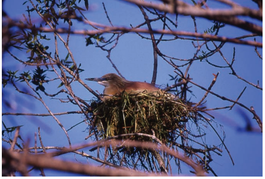
Alaca balıkçıl yuvada ( Ardeola ralloides )

na “Dünya Ölçeğinde Korunması Gereken Alan Statüsü” verilmesini sağlamakta.