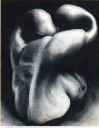
Edward Weston, Biber Weston, bu fotoğrafın her ne kadar biçimsel ve nesnel olduğunu söylese de duygusal olarak çok farklı çağrışımlar oluşturduğu ortadadır.

yenidensunum (gösteren) arasındaki ilişkide, ağırlıklı olarak kendisini hissettirdiğini görürüz. Zaten bulunuşundan beri fotoğraf, nesnelere birer kopyalarını oluşturduğunun düşünülmesi nedeniyle, resim ve desenlerin o güne kadar yürüttükleri görevi ele geçirmiş ve daha yetkin bir biçimde yürütmüştür. Bu duruma rağmen, A ancak B'ye benzediği ölçüde onun bir yenidensunumdur demek de pek olası değildir. Zira yenidensunum bir benzeşme halini içerebilir; ancak, onun gerçekleşmesi için gerekli değildir. Dolayısıyla bir nesne en yüksek ölçüde kendisine benzeyebilir, ancak kendi kendisinin yenidensunumunu oluşturamaz. Çünkü benzeşme olgusunun, en azından kendi dışında bir varlığa yönelik olması gerekir. Bütün bunlar bir yana, simetrik bir yapı gösteren benzeşimde "A, B'ye benzediği oranda B de A'ya benzer" önermesi geçerlidir. Oysa Franz Kafka'nın fotoğrafı, F. Kafka'nın bir yenidensunumunu oluştururken, F. Kafka'nın kendisi kendi fotoğrafının bir yenidensunumunu oluşturamaz.