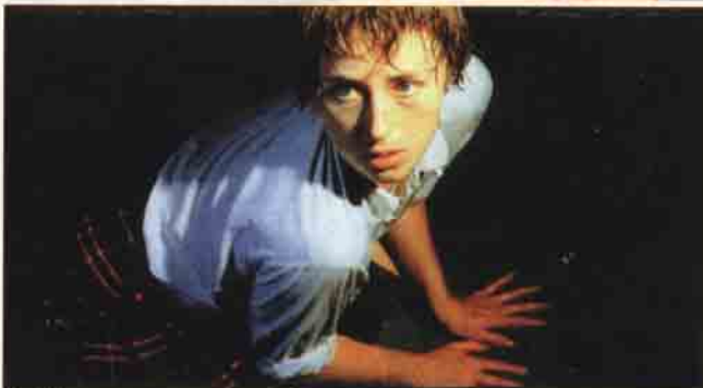
Cindy Sherman, ikisi de bir kadın fotoğrafı olmasına rağmen, iki fotoğrafın da duyuşsal anlamda ulaştırdığı bilgi farklıdır.