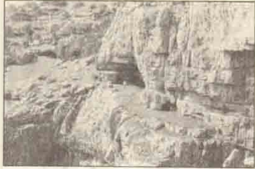
Büyük Tinaz Mağarası'nın ağız kısmı

İp çekilmiş gibi dümdüz asfalt yolları jipi- mizle hızla katederek Toroslar'a tırmanışa geçiyoruz. Yol dik ve virajlı. Karşımızdan hızla geliyor ve geçip geçen maden yüklü kamyonlardan ve bir kenarı uçurumlu virajlardan fırsat buldukça, epey gerilerde ve aşağılarda kalan geniş Suğla Ova- sı'nı, bir kenarındaki Seydişehir'i ve kentin ku- zeyine doğru kurulan Etibank Alüminyum Tesis- leri'nin yüksek bacalarını uçak penceresinden bakar gibi seyrediyoruz. Yolun çevresi, düzgün tabakalı kireçtaşı kayalarından oluşmasına kar- şın, sıkça çam türü ormanlarla kaplı. Dik ve virajlı yolları geçerek belirli bir yüksekliğe eri- ştik. Hafif inişli ve çıkışlı yolda hızla ilerliyoruz. Şimdi Seydişehir 25 km. gerimizde kaldı. İleride, Alüminyum Fabrikası'na hammadde sağla- yan Mortaş Boksit İşletmeleri görülüyor. Üst kısmaları bıçakla kesilmiş gibi açılmış tepeler, pasa ile (kaya molozu) doldurulmuş vadiler ara- sında pasa ve maden taşıyan 30-40 tonluk dam- perli kamyonlar ve dev yükleyiciler ister iste- mez dikkatimizi çekiyor.