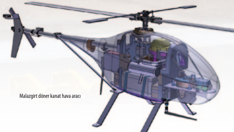
Malazgirt döner kanat hava aracı