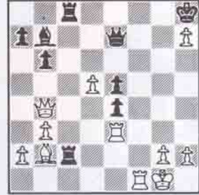
a b c d e f g h 28.Vb4!! (hamle siyahta) Zukertort-Blackburne

Johannes Hermann Zukertort, satranç tarihinin en parlak yıldızlarından biriydi. 1886 yılında Dünya şampiyonu Steinitz'le yaptığı ünvan maçında 4-1 önde iken, deneyimli ve soğukkanlı Steinitz, bu maçı 5-10 kazanmasını bildi. Zukertort bu acı yenilgiden 2 yıl sonra 46 yaşında öldü. Romantik çağın ünlü oyuncularından Anderssen'e benzeyen Zukertort, unutulmaz oyunları satranç dünyasında her zaman hatırlanacaktır. 1883 yılında Londra turnuvasını Dünya şampiyonu Steinitz'in 3 puan önünde birinci olarak bitirmişti. Zukertort'un bu turnuvada oynadığı şaheser bir oyunu sizlere sunuyoruz.