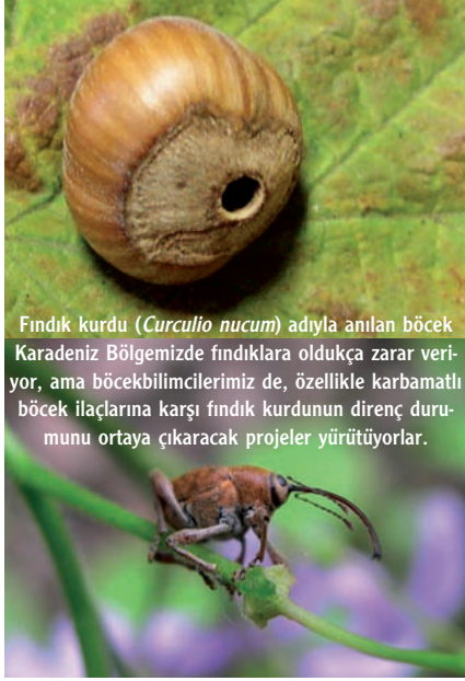
Fındık kurdu ( Curculio nucum ) adıyla anılan böcek Karadeniz Bölgesinde fındıklara oldukça zarar veriyor, ama böcek bilimcilerimiz de, özellikle karbamatlı böcek ilaçlarına karşı fındık kurdunun direnç durumunu ortaya çıkaracak projeler yürütüyorlar.

Metabolik dirençte, dirençli böcekler zehirli maddeleri duyarlı böceklerden daha hızlı etkisiz hale getirmekte ya da zehirli maddeyi hızlıca vücutlarından atabilmekte. Bu tip direnç en yaygın