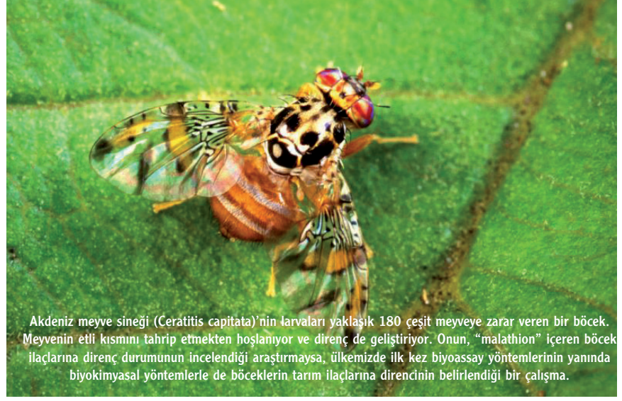
Akdeniz meyve sineği ( Ceratitis capitata )'nin larvaları yaklaşık 180 çeşit meyveye zarar veren bir böcek. Meyvenin etli kısmını tahrip etmekten hoşlanıyor ve direnç de geliştiriyor. Onun, “malathion” içeren böcek ilaçlarına direnç durumunun incelendiği araştırmaysa, ülkemizde ilk kez biyoassay yöntemlerinin yanında biyokimyasal yöntemlerle de böceklerin tarım ilaçlarına direncinin belirlendiği bir çalışma.

Dünyada özellikle son otuz yıldır, tarımsal ilaçlara ve dolayısıyla böcek ilaçlarına karşı böceklerin ve akar gibi diğer cinslerin geliştirdikleri direnç ko-