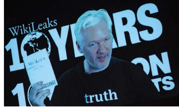
Wikileaks'in kurucusu Julian Assange