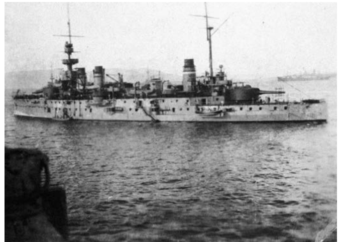
Limni adası, Mondros Limanı'nda bir Fransız savaş gemisi, 1915