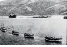
Anzak Koyu'na asker taşıyan gemi ve botlar, Çanakkale 1915 (Üstte)

Yirminci yüzyılın başlarında yok olma tehlikesiyle karşı karşıya olan Osmanlı Devleti'nin girmek zorunda kaldığı I. Dünya Savaşı'nın en destansı cephesi, Çanakkale Cephesi'dir. 1815 yılında toplanan Viyana Kongresi'nin bir sonucu olarak, Avrupa'nın siyasi haritası, mevcut durumuyla kalıcı şekilde biçimlendirilince, emperyalizmin yöneleceği en gözde coğrafya, Osmanlı Devleti'nin egemenlik alanı oldu. Çünkü on yedinci yüzyılın sonlarından itibaren gerilemeye başlayan Osmanlı Devleti'nin kayıpları giderek arttı ve devletin güçsüzleştiği açıkça anlaşılmaya başladı ve I. Dünya Savaşı öncesinde Osmanlı Devleti, Avrupa ve Afrikadaki topraklarının hemen hemen hepsini kaybetti.