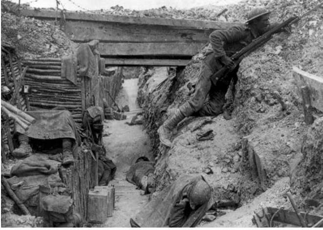
Gelibolu'da bir Anzak siperi