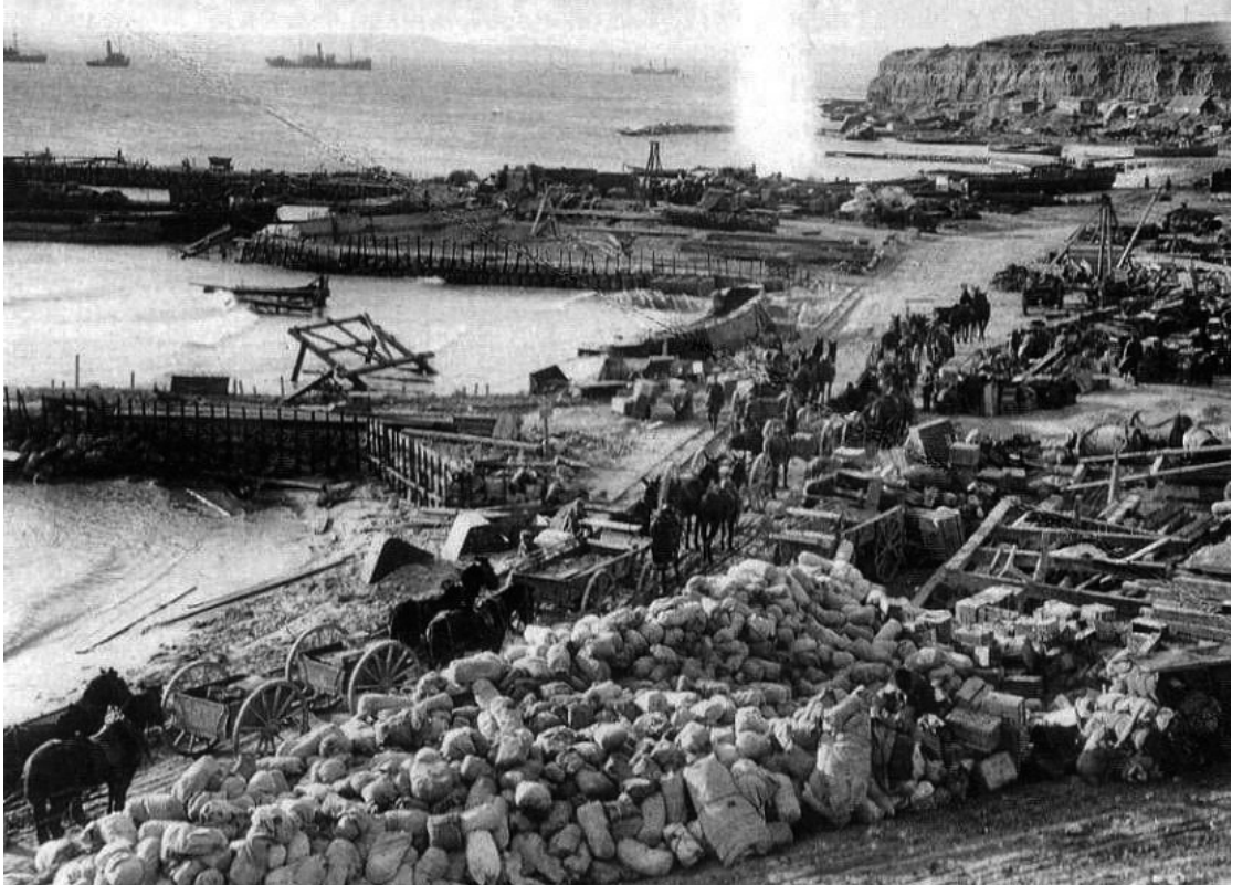
Gelibolu'da Anzakların çıktığı sahil, Çanakkale 1915 (Sağda)