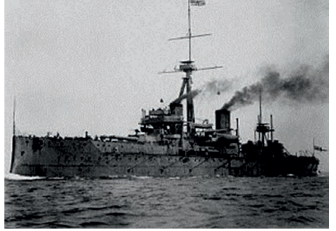
İngiliz dretnotu (HMS Dreadnought adıyla bilinen bu gemi, 1905 ile 1906 yılları arasında inşa edilmiş ve I. Dünya Savaşı'nda kullanılan ilk zırhlı gemilerden biri olmuştur.)

da kıyıdan başlayan top atışı altında neye uğradıklarını bilemedi. Beklenmedik şekilde maruz kaldıkları bombardıman altında, düşman gemilerinin düzenleri bozuldu ve kıyılara yakın yerlere düşmüş mayınlara doğru yöneldiler. Bu yönelme, güçlü ve mağrur düşman donanmasını bekleyen büyük felaketin başlangıcı oldu. Güneşin batışına kadar İtilaf Devletleri donanmasına ait 18 gemiden 7'si ya mayınlara çarparak ya da Türk topçusunun isabetli atışlarıyla Çanakkale Boğazı'na gömüldü. Bu gemiler Irresistible , Ocean , Inflexible , Majestik , Gaulois (Golyat) , Triumph ve Bouvet adlı gemilerdir. Birçok gemi de savaşamaz hale geldi.