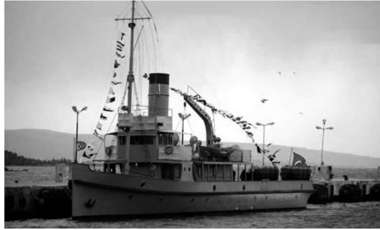
Nusret mayın gemisi

yıldan fazla sürmesi, aynı zamanda bu savaşın bütün cephelerinde yeni savaş teknolojilerinin kullanıldığının da göstergesidir. Savaş gemilerinde buhar enerjisinden yararlanılmaya başlanınca, İngiltere çok güçlü zırhlara ve büyük toplara sahip dretnotlar yaptı. Buhar gücüne dayalı olan dretnotlar 305 mm'lik 10 ana batarya, tek ve çift namlulu 5 taret (zırhlı kule) ve 24 küçük top-la donatılmıştı. Bunlar, uçak yapımı gelişinceye kadar savaşlarda önemli rol oynadı. Yine bu dönemde, özellikle İngilizler tarafından yapılan denizaltılar dikkat çekicidir. 1901'de İngiliz tersanelerinde imal edilen ve A sınıfı olarak denize indirilen denizaltılara, 1905'te 40 metrelik B sınıfı, 1908'te de C, D ve E sınıfı denizaltılar katıldı. Çanakkale Savaşı'nda İngilizler ve Avustralya Deniz Kuvvetleri tarafından kullanılan E sınıfı denizaltılar 589 tonluk, 54 metre uzunluğunda, su üstünde 15 knot, su altında 9 knot hız yapabilen, 4 torpido kovanına karşı 8 torpido kovani taşıyabilen bir savaş silahı olarak ortaya çıktı. Böylece Çanakkale Savaşı kara, deniz ve denizaltı kuvvetlerinin kullanıldığı bir savaş oldu.