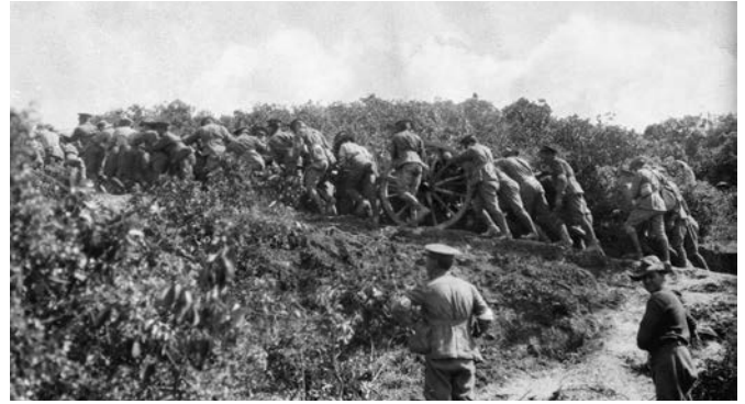
Australyalı topçular silahlarını mevzilerine taşıyor, 25 Nisan 1915 Çanakkale.

I. Dünya Savaşı'nın başlamasının hemen ardından İngiltere ve Fransa, Almanya karşısında zor durumda kalan müttefikleri Çarlık Rusya'sına silah ve malzeme yardımı yaparak askeri gücünü takviye etmek, İstanbul'u alarak Osmanlı Devleti'ni savaş dışı bırakmak ve tarafsız devletleri (Yunanistan ve Bulgaristan) kendi yanlarına çekmek için Çanakkale Boğazı'nı geçmeye karar vermişti. Ancak boğazın nasıl geçileceği konusunda İtilaf Devletleri arasında görüş ayrılıkları başladı ve sonunda Fransa'nın, Çanakkale Boğazı'nı yalnızca donanma taarruzu ile geçme stratejisi taraflarca benimsendi. İngiltere ve Fransa'nın, Almanya'yı hırslı ve tehlikeli bir rakip olarak görmesi ve Almanya'nın gemi yapımını hızlandırması, özellikle İngiltere'yi denizlerdeki üstünlüğünü korumak amacıyla donanmasını yeniden düzenlemeye yönlendirdi ve İngiltere dretnot olarak bilinen yeni bir zırhlı tipinin yapı-