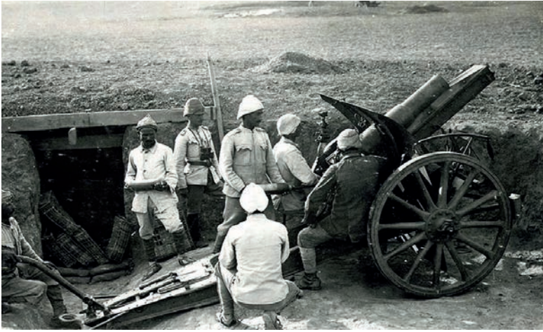
Krupp yapımı obüs