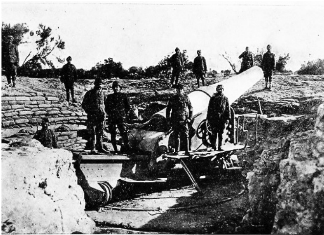
Seddülbahir'de düşmandan zapt edilen 24 mm çapında bir top

Çanakkale'de kullanılan toplar I. Dünya Savaşı'ndan 25-30 yıl önce satın alınarak tabyalara yerleştirilmişti. 22 cm çap uzunluğundaki 7000-8000 m menzilli toplar, özdeş bataryalar oluşturmayacak şekilde karışık dizilmişti. Bu toplarda itici güç olarak kara barut kullanılıyordu.