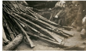
Osmanlı askerlerinin Çanakkale'de kullandıkları tüfekler, 1915

bırakıldı ve 18 Mart'ta topa tutulan Türk mevzilerinin tamamen imha edildiği hesap edilerek boğaz geçilmeye çalışıldı. Böylece boğaza giren ve ilerlemeye başlayan düşman birlikleri, Türk topçuların menziline girdikleri an-