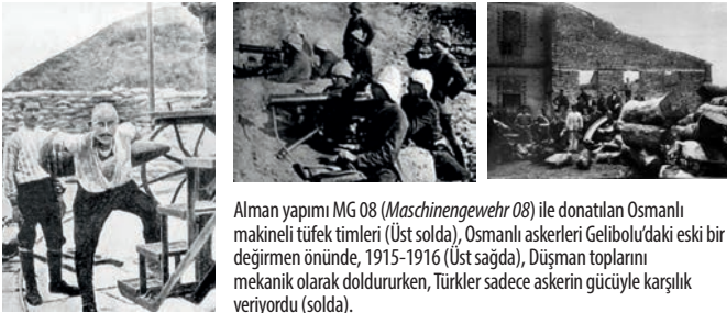
Alman yapımı MG 08 ( Maschinengewehr 08 ) ile donatılan Osmanlı makineli tüfek timleri (Üst solda), Osmanlı askerleri Gelibolu'daki eski bir değirmen önünde, 1915-1916 (Üst sağda), Düşman toplarını mekanik olarak doldururken, Türkler sadece askerın gücüyle karşılık veriyordu (solda).

Ancak kara barut ile yapılan atışlardan sonra çıkan duman hedefin görülmesine engelliyor ve topların ateş hızının düşmesine neden oluyordu. Diğer yandan 16.900 ve 14.800 m menzilli 355/55'lik ve 240/35'lik toplar, Çanakkale Boğazı'nın en güçlü topları idi. 5 adet 355/35'lik ve 17 adet 240/35'lik top vardı. Bunlar Krupp, Kruzo, Vickers ve Snayder fabrikalarından değişik zamanlarda alınmış ve top çapları göz önünde bulundurulmaksızın, plansız ve karışık olarak sıralanmıştı. Bu durum, yedek parça ve cephane bütünlemesini, topçuluk kurallarının uygulanmasını ve zaten güçlü olmayan savaşma yeteneğini daha da azaltıyordu.