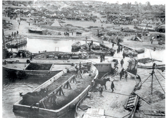
Gelibolu'daki (Ertuğrul Koyu'nda) İtilaf Devletleri askerleri