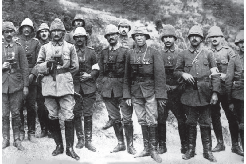
Mustafa Kemal ve arkadaşları Arıburnu Cephesi'nde

Dünyanın denizden kontrol edilebilmesi konusu her dönemde yayılcı devletlerin gündemini oluşturmuş ve bu açıdan stratejik önemi olan Çanakkale Boğazı'nın ele geçirilmesi bu devletlerin en büyük düşü ve amacı olmuştur. Bu amaçlarını gerçekleştirmek için her türlü ayrıntıyı göz önüne alan bir senaryo eşliğinde harekete geçen emperyalist devletler, güçlü ve modern silahlarla donatılmış savaş gemileriyle Çanakkale'yi geçmeyi planlamıştı. Bu muazzam savaş gemilerini görünce dirençlerinin kırılacağı ve adeta kendiliğinden teslim olacakları sanılan Türklerin her bakımdan kısıtlı ve yetersiz savaş araç gereçleriyle önce denizden, sonra da karadan gösterdiği beklenmedik direniş, saldırgan devletleri geri püskürtmüş ve Boğazın savunulmasında sergilenen kahramanlık tarihin gerçek destanlarından biri olmuştur. Çanakkale Boğazı'nın geçilemeyeceğinin gösterilmesiyle, Boğazlarda tek söz sahibinin Türkler olduğu ilan edilmiş, Doğunun ve Batının emperyalist devletlerinin dünyaya egemen olma arzuları da gerçekleşmemiştir.