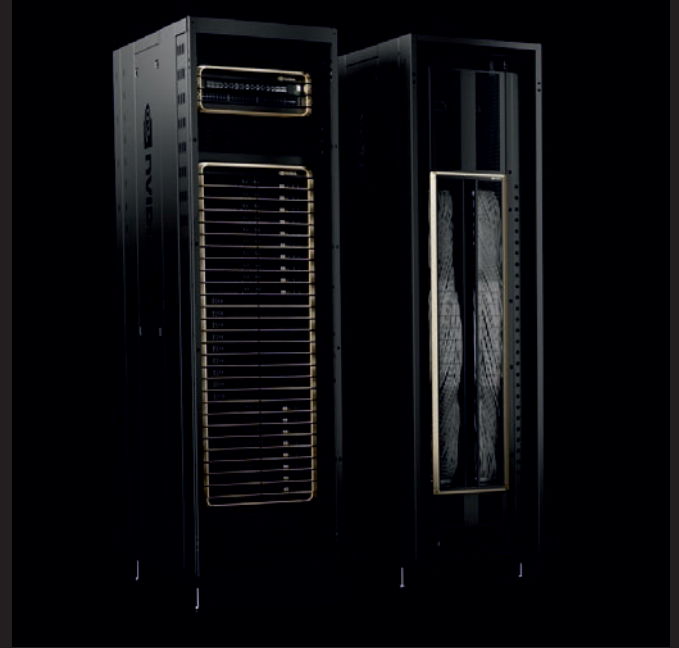
Büyük dil modellerini eğitmek için kullanılan çipler