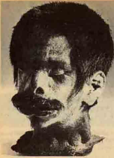
Bir Ekvator melezinin ufaltılmış kafası; bu kafa çok yenidir (XIX. ve XX. yüzyıl). Yüksekliği 12,3 cm., genişliği 7,6 cm.

eşyasıdır". Hamlet'ten önce Orta Çağ iskeletlere bayılırdı. Baudelaire ise "ölüler dansının evrensel sallantısı sizi hiç tanımadığınız dünyalara sürükler" diyordu.