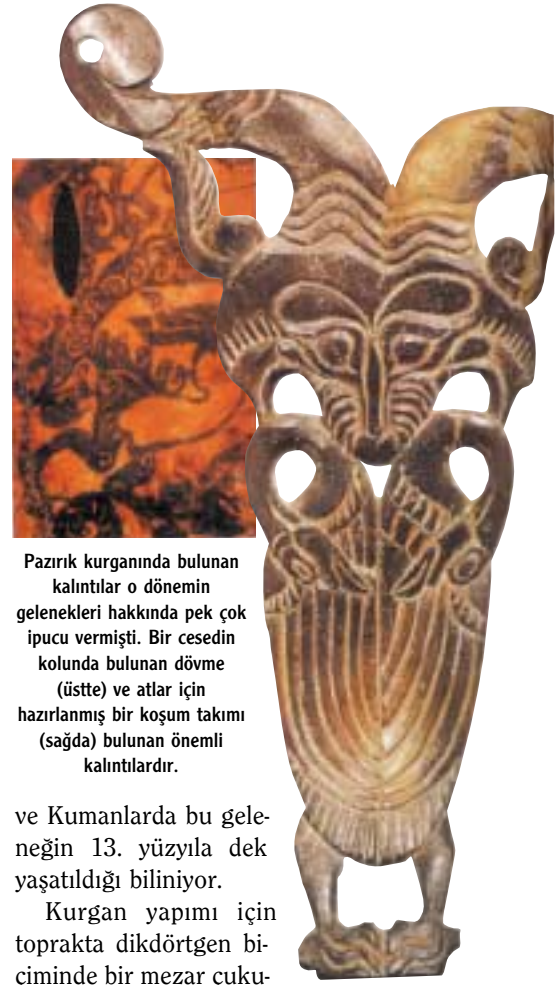
Pazırık kurganında bulunan kalıntılar o dönemin gelenekleri hakkında pek çok ipucu vermişti. Bir cesedin kolunda bulunan dövme (üstte) ve atlar için hazırlanmış bir koşum takımı (sağda) bulunan önemli kalıntılardır.

ve Kumanlarda bu geleneğin 13. yüzyıla dek yaşatıldığı biliniyor.