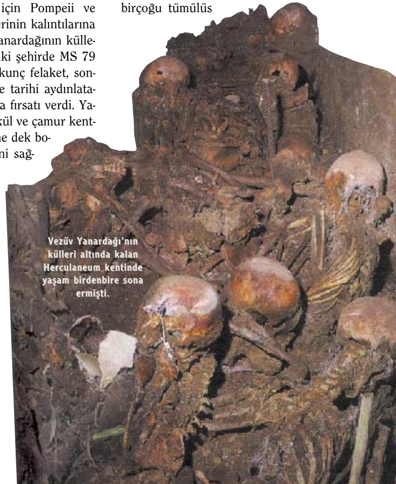
Vezüv Yanardağı'nın külleri altında kalan Herculaneum kentinde yaşam birdenbire sona ermişti.

Mezarlar bize birçok biçimde yapıldıkları tarihe ilişkin ipuçları verirler. Mezarın tipi, içinde barındırdığı kişinin cinsiyeti ya da toplumsal konumu, hatta mezarın şekli ve nasıl yapıldığı pek çok şey anlatır. Neolitik çağdan ve ilk tunç çağından kalma mezarların birçoğu tümülüs