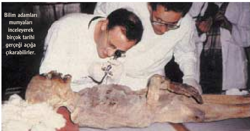
Bilim adamları mumyaları inceleyerek birçok tarihi gerçeği açığa çıkarabilirler.

Kaynaklar: Ceram, C., W., Tanrılar Mezarlar ve Bilginler, Remzi Kitabevi, Çeviri: Hayrullah Örs, 1969 Maisels, C., K., Uygarlığın Doğuşu, İmge Kitabevi, Çeviri: Alâeddin Şenel, 1999 Özbudun, S., Ayinden Törene, Anahtar Kitaplar, 1997