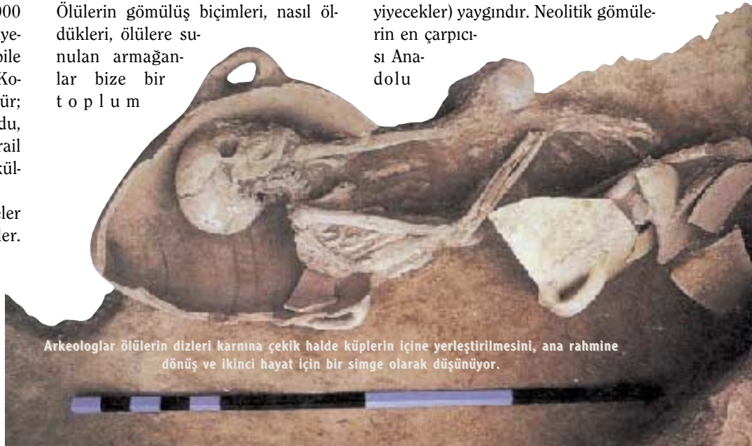
Arkeologlar ölümlerin dizleri karına çekik halde küplerin içine yerleştirilmesini, ana rahmine dönüş ve ikinci hayat için bir simge olarak düşünüyor.

Ölü gömme geleneklerine Ön Asya neolitiğinde sıkça rastlanır. Konut içi (Intramural) gömülerin yanı sıra, protoneolitik dönemde (MÖ 9-7 bin) konut alanlarının dışında ayrı mezarlık alanlarına rastlanmakta. Ölümlerin gömülüşünde belirli bir tarz öne çıkmaz. Gömü buluntularındaki iskeletlerin bazıları hoker (dizler karına çekilmiş, ana rahmindeki gibi bir duruş) pozisyonundayken, bazıları uzatılmıştır. Gömü armağanları (takı, boncuk, silah ve avadamlıklar, denizkabukları, çeşitli yiyecekler) yaygındır. Neolitik gömülerin en çarpıcısı Anadolu