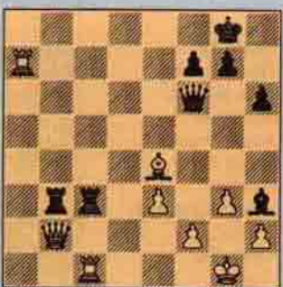
2) Siyah oynar