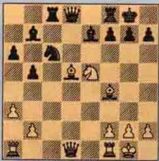
1) Beyaz oynar