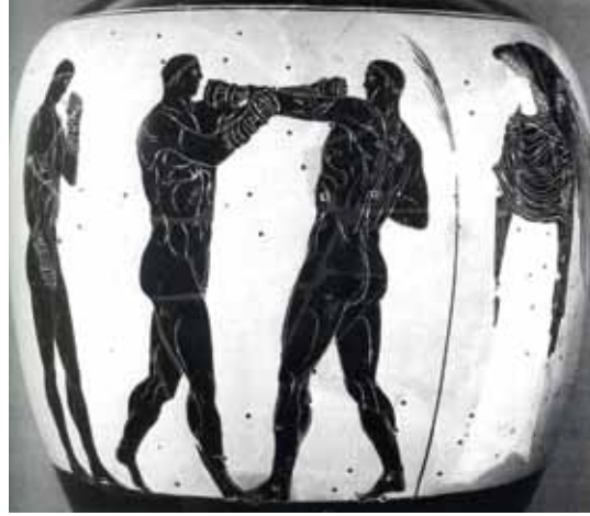
Palaestra'da spor yapanlar, vazo resmi

Ortalama bir Romalı için iş çıkışı hamama gitmek, çeşitli oyunlar ve bedensel egzersizlerin arkasından tanıdıklarıyla sohbet etmek, sıcak suyla banyo yapmak yeri başka bir şeyle doldurulamayacak bir alışkanlıktı. Bu alışkanlıkla ilgili en çok anlatılan anekdot, Roma imparatorlarından birinin, kendisine neden her gün bir kez hamama gittiğini soran bir yabancıyı iki kere gitmeye zamanı olmadığı şeklinde yanıtlamış olmasıdır.