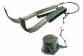
MÖ birinci yüzyıla ait strigil http://en.wikipedia.org/wiki/Strigil

Güneş doğmadan önce uyanan kentli Romalıların ilk işleri kahvaltı etmek olurdu. Yoksullar bir yandan işlerine gitmek için hazırlanırken bir yandan da ayaküstü ekmek, su, şarap, zeytin ve belki peynirden oluşan kahvaltılarını yapardı. Zenginler ise et, balık, sebze, meyve, bal (şeker henüz bilinmiyordu) ve ekmekten oluşan zengin bir kahvaltıya otururdu. Kahvaltıdan sonra yetişkinler günlük işleriyle ilgilenir-