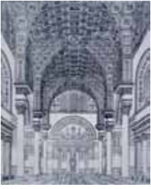
Caracalla Hamamı'nın 1899 yılında çizimle canlandırılmış hali