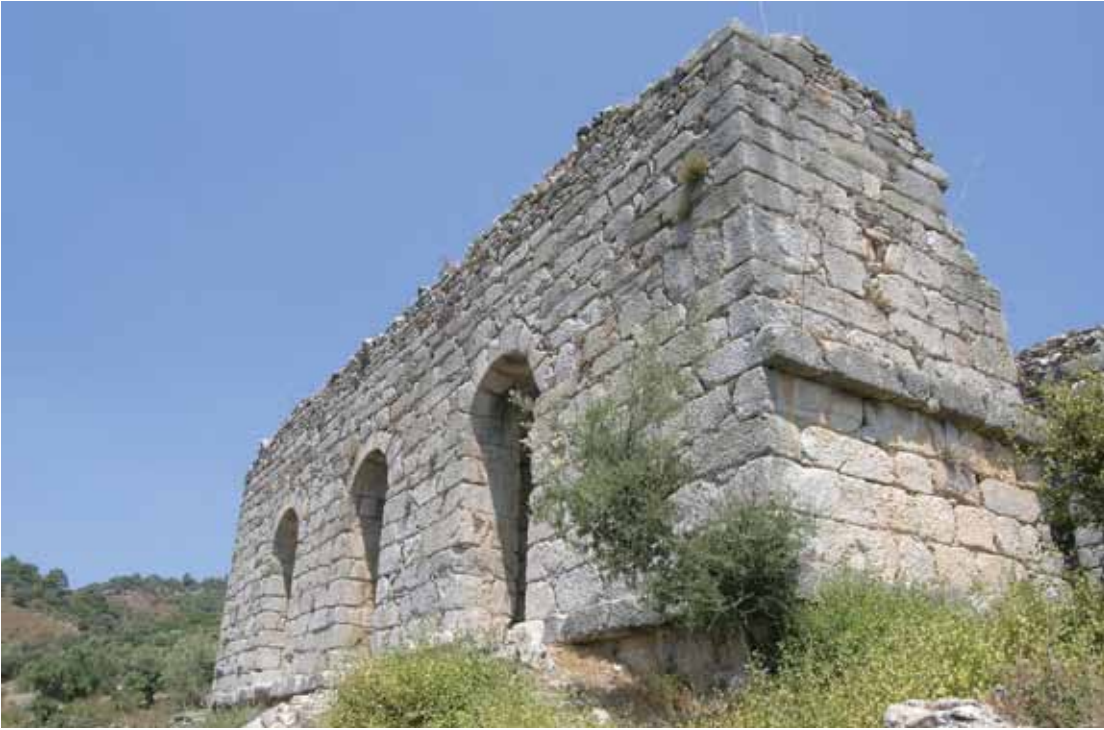
Calidarium ön cepheden görünüş

Ambulacrum odalarının ortasında bulunan ve tam merkezde yer alan frigidarium yani soğuk banyo odasında 8,25 mx4,85 m büyüklüğünde, 1,35 m derinliğinde havuz bulunur. Etrafı oturma platformuyla çevrili havuza oda yönünden iki basamakla inilir. Tabanı ve yan duvarları zamanında camgöbeği mavisi mermer plaklarla kaplı olan bu mekânın Bizans Çağında kilise olarak kullanıldığı düşünülmektedir.