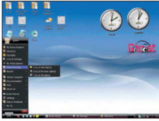
Ghost VC işletim sistemi, çalışmak için İnternet bağlantısından başka bir şeye ihtiyaç duymuyor.

İnternet'te kendi yıldızınızı oluşturarak zaman içinde geçirdiği bütün evreleri gözlemleyebilirsiniz