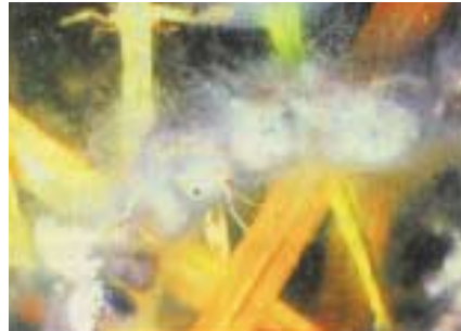
Azalan yağışlarla alçalan göl suları kurbağa yumurta ve larvalarını (solda) morötesi ışınımına maruz bırakıyor ve bunlar üzerinde öldürücü bir mantarın gelişmesine yol açıyor. (sağda)

Science, 9 Şubat 2001 Nature, 5 Nisan 2001 Science, 13 Nisan 2001