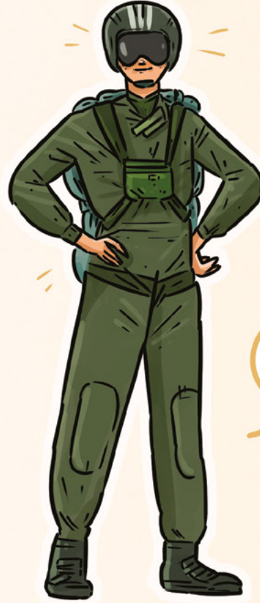
Jet uçağı pilotu