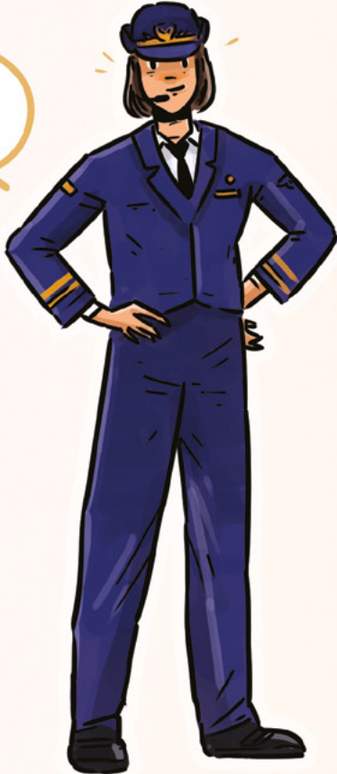
Yolcu uçağı pilotu