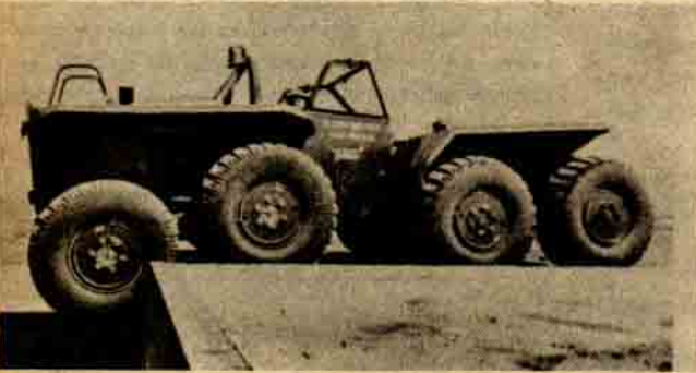
Ve bütün araç,