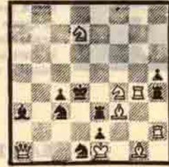
3 HAMLEDE MAT (Şahmatı'dan)

Şekil 44'de beyaz vezirini feda ederek siyah şahı bloke ediyor: 1. A7e6 + Şe8, 2. Vf8 +! A: f8, 3. Ag7X.