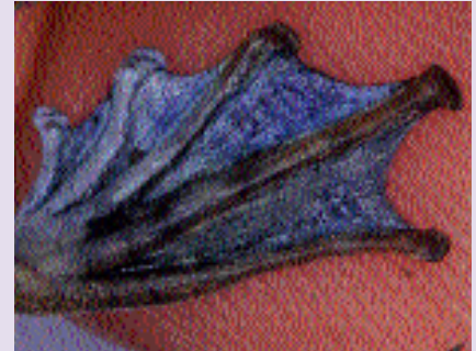
Ayak perdelerinin mavi renkte olması, Stauois natator ayağının uyarı etkisini güçlendiriyor (üstte). Küçük boydaki küçükkağızlı kurbağalarının erkekleri ön bacaklarıyla işaret ederler (solda).

doğru kaldırmaya başlarlar. Kuzey Borneo'da yaşayan bir kurbağa türü, o kadar heyecanlı ki, her iki arka ayağını aynı anda kaldırır. Başka türlerse, önlerine ayna yerleştirildiği zaman, kendi kendilerini bile ürkütmeye çalışırlar.