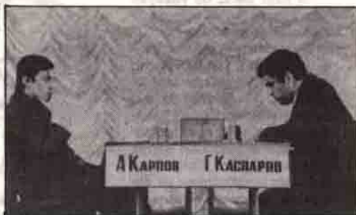
Dünya şampiyonası maçı böyle oynandı.

çaları ile mükemmelen yönetiyor. Yumuşak hareketleri ve esprili dolu tatlı uslubuyla, çocuklarla arkadaşça konuşuyor. 14 yaşındaki Gary Kasparov, on yıldır okula devam eden yetenekli çocukların başında geliyor. Ünvanı, usta adayı, Hocasına oynamış olduğu bir oyunu gösteriyor. O kadar hızlı analiz yapar ki heyecanla anlatıyor ki, arkasından atlı yetişemez. Botvinnik "ağır ol bakalım Gary!" diyor. "Biraz serin gel!" Ve analizin direksiyonunu kendi eline alıyor. Yetenekli öğrencisinin gözünden kaçan bir hatayı yakalayan Botvinnik, "Neden bu hatalı hamleyi seçtin?" diye soruyor. "Çünkü," diye kekeliğe Gary "Bu hamle daha önce falan oyunda oynanmıştı ve siyah üstün duruma geçmişti." Botvinnik hemen gerçeği anlatıyor. "Hiç bir zaman otoritelere güvenme. Her şeyden önce kendine güven! Herkes hata yapabilir. Doğruyu kendin düşünerek bulmağa çalışmalısın!" Bu arada Gary'nin yanında bulunan annesi de ev ödevlerini not ederek, ikinci bir antrenör gibi oğluna yardımcı oluyor.