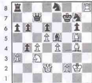
III. Beyaz kazanır.