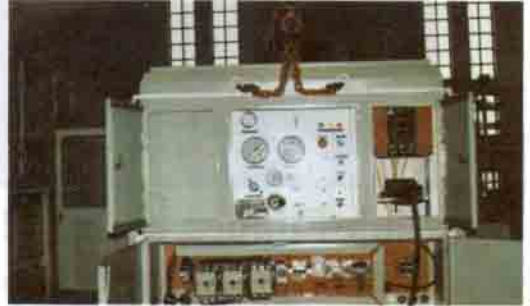
Makinenin elektrik kumanda paneli.

ise özel kesici halatı saatte 150 km hızla çeviriyor. Mermer blokların kesilme işlemi ise şöyle: Önce blok üzerine yatay ve dikey olarak 5-10 metrelik iki delik delinir. Delikler birbiriyle birleştirilerek içinden kesici halat geçiriliyor. Daha sonra halat makinenin kasnağına bağlanarak yüksek hızla döndürülüyor. Bu şekilde mermer kesilirken, makine, ray üzerinde geri geri ilerleyerek halatın gerginliğini sabit tutuyor.