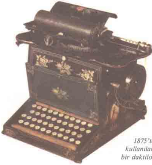
1875'te kullanılan bir daktilo.

ından yönetilmektedir. Programlama "sektör" ve "ortam" bazlarında yapılmıştır. Bir "sektör", cam endüstrisi, kış sporları, ekoloji akımı veya kadın modası gibi ilgili fiziksel, sosyal ve/veya ekonomik yapıların toplamı olarak tanımlanmaktadır. Olası sektörlerin sayısı sonsuza varabileceğinden, SAMDOK koleksiyon kararlarını, bir kontrol cetveli önerisi ile yönlendirmeye çalışmaktadır. Öte yandan, üç farklı ortamda (ev ortamı, iş ortamı, sosyal ve ticari ortam) dokümantasyon sürdürülmektedir.