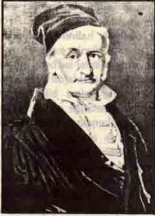
Carl Friedrich Gauss

çine çizilebilir, buna karşı 7, 11, 13... kenarlılar çizilemez. Eski Yunan'dan beri bilinen şey ise kenar sayısının 2^m , 2^m \cdot 3 , 2^m \cdot 5 , 2^m \cdot 15 olduğu hallerde poligonun çizilebileceği idi. Gauss insanların 2000 küsur yılda bulamadığı şeyi genç yaşta bulmuş oluyordu. Kitabında Congruence (uygunluk) diye bilinen yeni bir kavram geliştirdi. Bu kavramın genişletilmesi modern matematikte önemli rol oynayan Eşdeğerlik (equivalence) sınıflarına yol açtı. Gauss, Euler ve Legendre'in da incelemiş olduğu 2. dereceden karşılıklı (quadratic reciprocity) adlı büyük probleme 6 çözüm buldu. Daha 14 yaşında iken bulunduğu şu formül de ilginçtir: x bir asal sayı ise ve x 'den daha küçük asal sayıların sayısı \pi(x) ise büyük sayılar için \pi(x) = x/\log x (yaklaşık olarak).