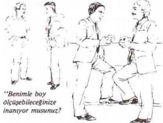
Benzer hareket: Sempati

Bir görüşme anında sabrınızın taşmaması ve böylece sonucun tehlikeye girmemesini istiyorsanız, toplantıyı bitirme isteğinizi şöyle hissettirebilirsiniz: Her iki el dizlerin üzerine konur ve vücudun üst kısmı öne eğilir. Anlamı ise adam her