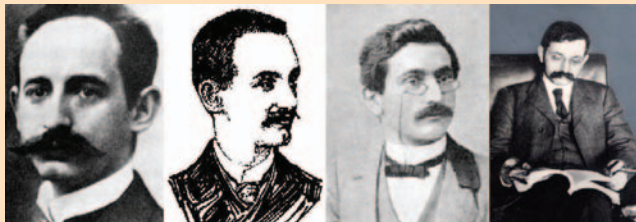
Karl Schlechter ve Emanuel Lasker

Dünya Şampiyonlarından Mikhail Tal adeta bir masal kahramanıydı. Genç yaşta hızlı bir yükseliş, benzersiz oyun stili ve başından geçen inanılmaz olaylar nedeniyle kendisine "Riga Sihirbazı" deniyordu. Ama sonra sağlık sorunlarıyla mücadele etmek zorunda kaldı hep. Botvinnik, Tal için "Eğer sistema-