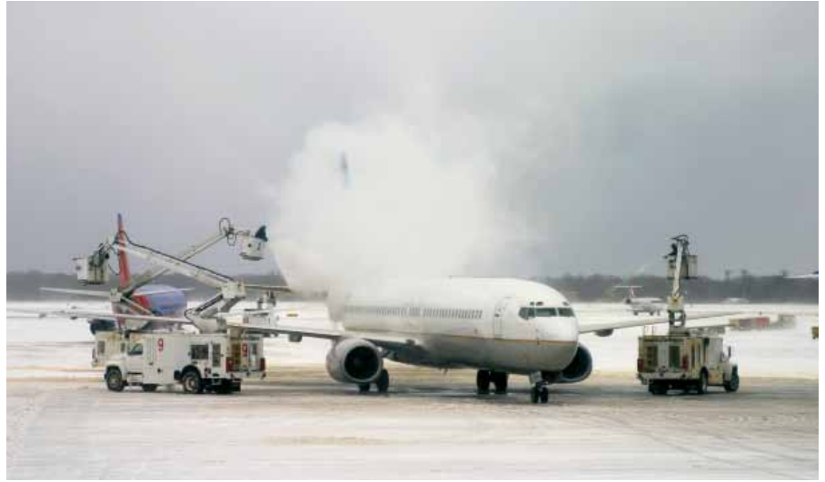
Uçak gövdesi üzerinde çeşitli kimyasal malzemeler ile yapılan buzlanma giderme çalışması.

Karpicke'ye göre, kavram haritalarıyla detaylandırarak çalışarak öğrenme yönteminin herhangi bir dezavantajı yok. Ancak bu çalışma, bilgiyi geri çağırma yönteminin bilimsel kavramları öğrenmede daha etkili olduğunu ortaya koyuyor.