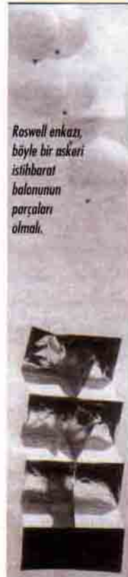
Roswell enkazı, böyle bir askeri istihbarat balonunun parçaları olmalı.