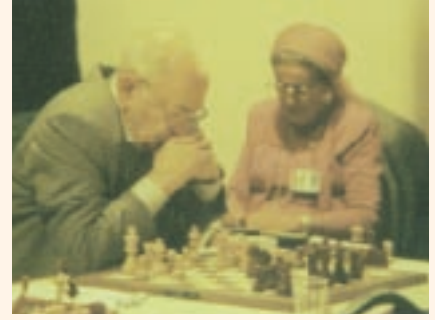
Eşi, 7 saati aşan oyunlarda olimpiyatın en yaşlı satranççısı (1931 doğumlu) Viktor Korchnoi'ü hiç yalnız bırakmadı.