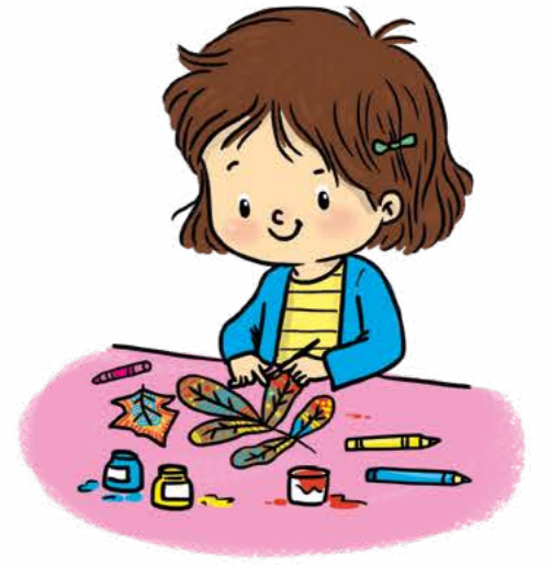
Yaprakların üzerine desenler çiz.