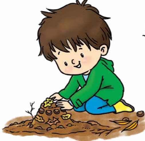
Çamur pastası yap.