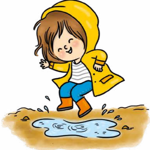
Su birikintisinde zıpla.