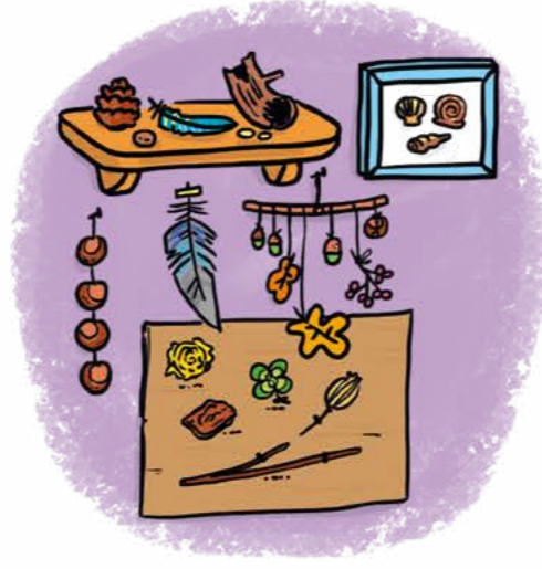
Evde bir doğa köşesi hazırla.