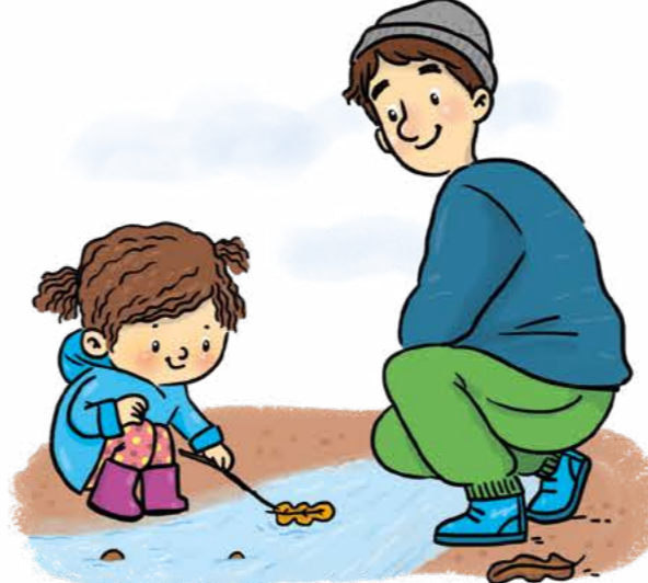
Bir su kenarında keşif yap.