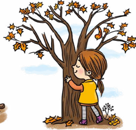
Bir ağaca sarıl.