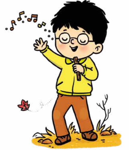
Sonbaharı anlatan bir şarkı söyle.