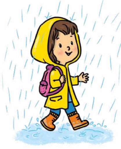
Yağmurlu havada gezintiye çık.