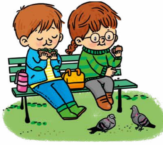
Parkta piknik yap.