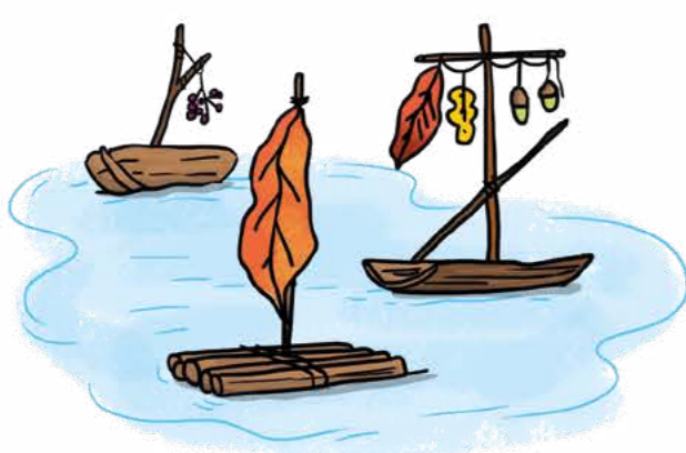
Doğal malzemelerden minik yelkenli tekneler yap.