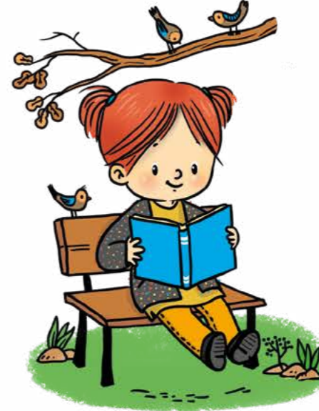
Açık havada kitap oku.