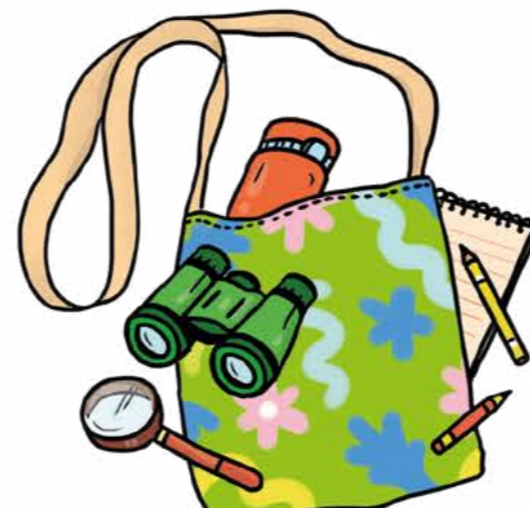
Açık havada dolaşırken yanına alacağın bir keşif çantası hazırla.