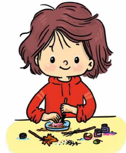
Doğal malzemelerle boya yap.