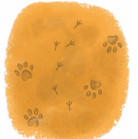
Hayvanların ayak izlerini bul.