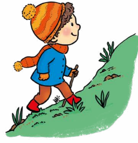
Bir tepeye tırman.