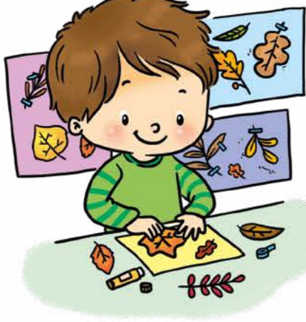
Yaprak koleksiyonu yap.