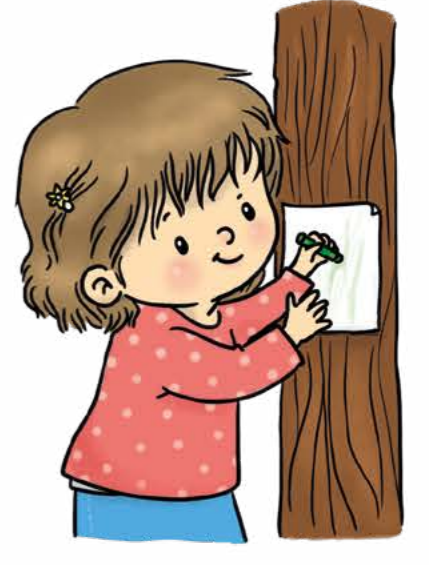
Ağaç kabuklarının izini çıkar.