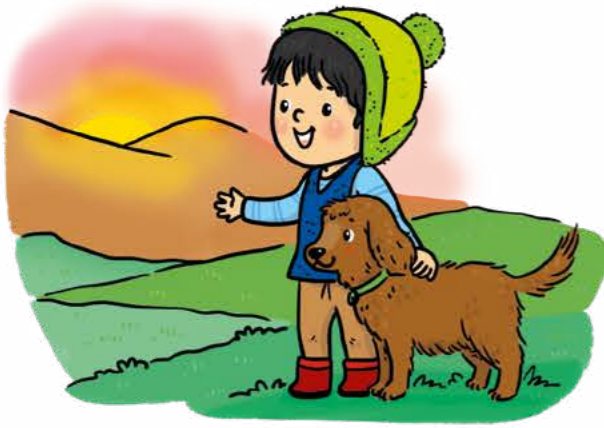
Güneşin batışını izle.