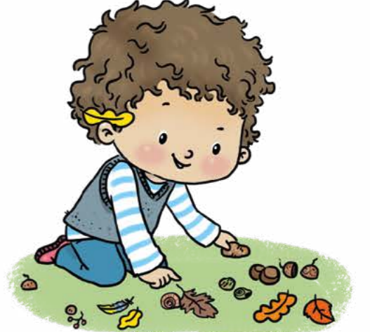
Doğada renk avına çık.