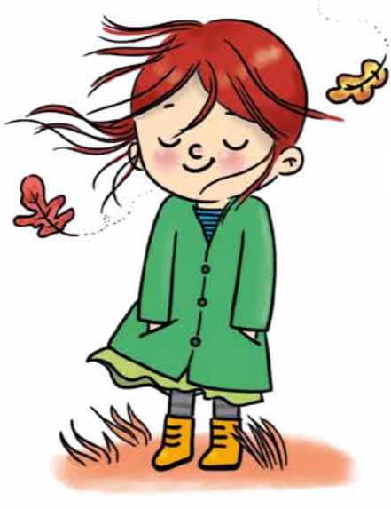
Rüzgârda gözlerini kapatıp çevredeki sesleri dinle.