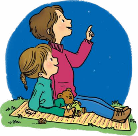
Gece gökyüzü gözlemi yap.