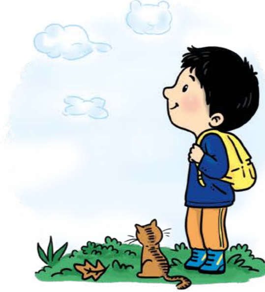
Bulutların oluşturduğu şekilleri gözlemler.