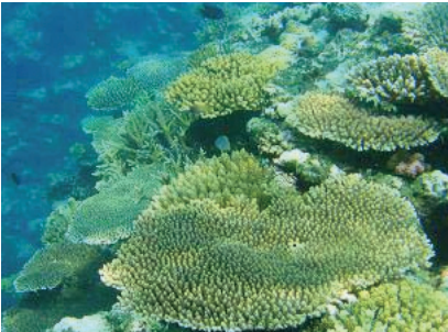
Acropora sp. (Oken, 1815): Genelde en çok yayılım gösteren aile olan Acroporidae familyası üyesidir. Sualtında iyi gelişmiş üyeler gözleniyorsa tanımlanması zor değildir. Üyeler genelde benzer ancak yapısal ayrıntılar farklılık gösterir.

Tropik yağmur orman ekosistemleriyle beraber dünyadaki en zengin tür çeşitliliğine sahip bu canlı toplulukları resifteki diğer küçük canlılara barınma ortamı sağlar. Red soil kirliliği meydana gelip, mercanlar ölmeye başladığında, doğru orantılı olarak yaşayan balık ve diğer canlı organizmaların sayısı da düşüş gösterir. Red soil kirliliği, Okinawa Bölge Sağlık ve Çevre Enstitüsü tarafından geliştirilen SPSS (deniz sedimentindeki asılı parçacık miktarı) metoduyla izlenir. Açık denizle ilişkili geniş kanallarda -güçlü rüzgârların büyük dalgalara sebep olduğu- askıdaki sediment kolayca karışır. Bu gibi alanlarda SPSS seviyesinde bazen mevsimsel değişimler meydana gelir. Ölçümlerde de SPSS değerleriyle mercan resifinin kapladığı alan arasında bir ilişki kurularak sonuca gidilir. Red soil meydana gelip SPSS değerleri yükseldiğinde mercan resifinin kapladığı alan azalır. Yapılan karşılaştırmalı araştırmalar