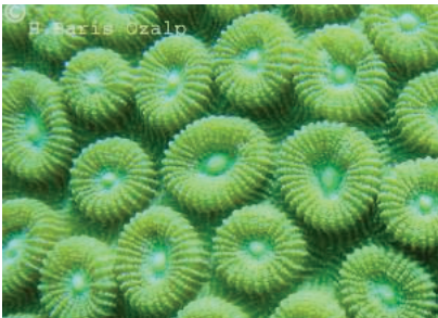
Favia sp. (Forsk., 1775): Faviidae ailesi üyeleri bu gruptadır. Diğer mercan aileleri arasında en düzenli ve geniş dağılım gösterenlerdendir. Tür tespiti kolay değildir. Türler genellikle büyük ya da kübe biçimlidir.

Okinawa kıyıların yaklaşık % 40'lık bir bölümünün red soil kirliliğiyle karşı karşıya kaldığını göstermekte ve temel karasal kaynaklı kirliliğin de zirai alanlardan kaynaklandığını ortaya koymakta. Önlem olarak, zirai alanlardan akan bu kirliliğin (toprak, gübre vb..) ölçülmesi önerilmekte. Çiftçiler de artık gelişmiş sistemler kullanarak devamlı bir şekilde akan kirlilik oranını ölçüp