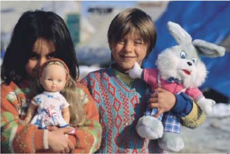
Deprem çocukları, Gölçük