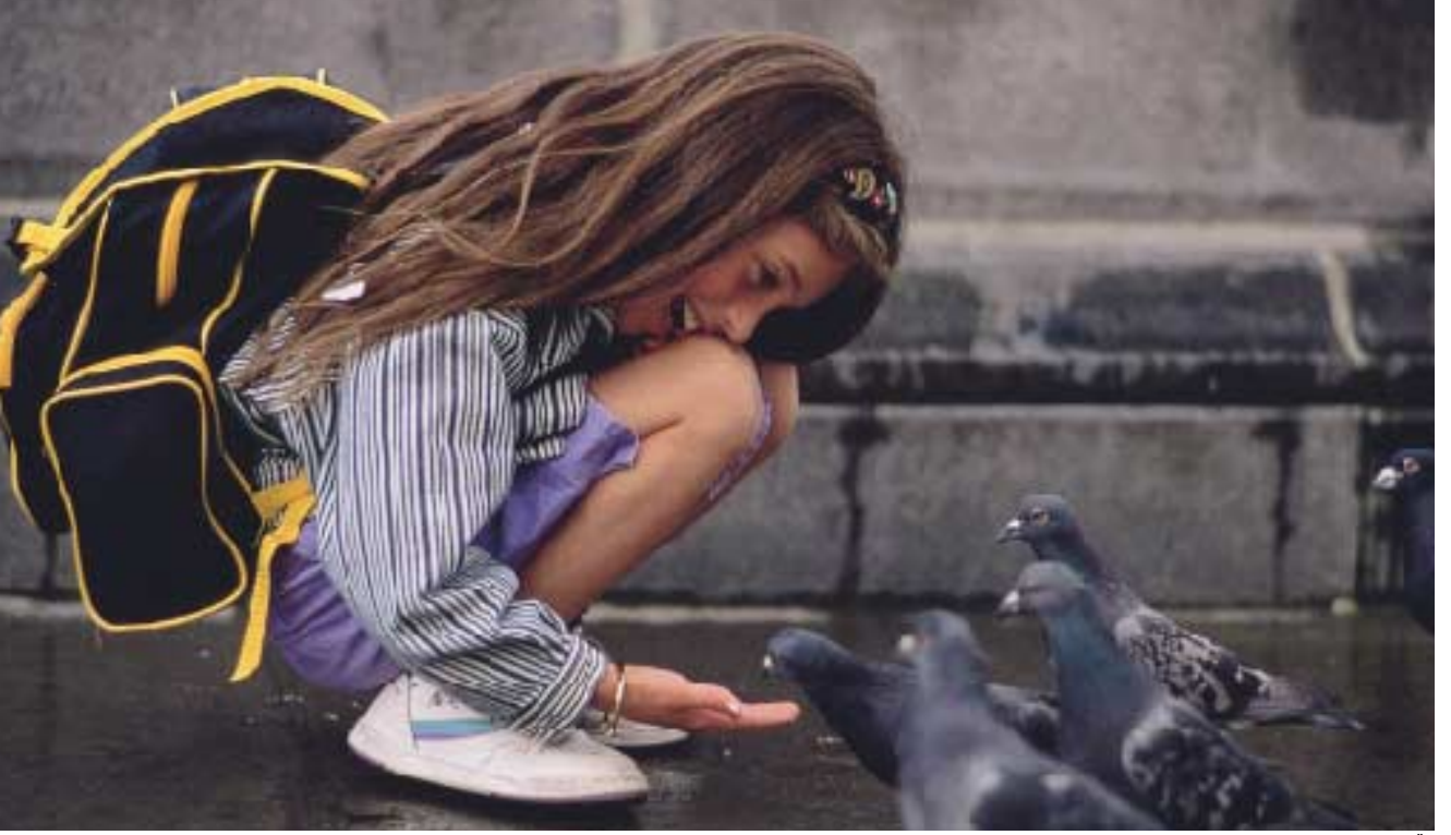
Çocuk ve güvercinler