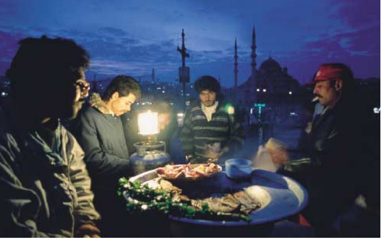
Galata - İstanbul