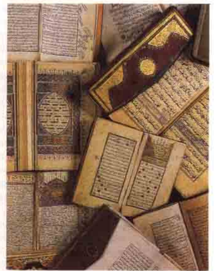
Tarih bölümlerinde verilen paleografya dersi, bambaşka bir dünyanın kapılarını açıyor..