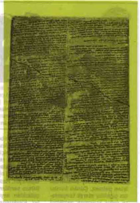
Büyük Hitit Çağına ait çivi yazılı bir tablet.

Bir fikir vermesi bakımından, Hitit yasalarının bir iki maddesini modern hukuk bilimine örnek olan Roma hukuku ile karşılaştırmak yararlı olacaktır. Roma hukukunu oluşturan "12 Levha Yasaları" (Leges Duodecim Tabularum) MÖ 451-450 yıllarında tamamlanarak forumda ilan edilmiştir. Bu yasalarında Hitit Yasaları Kitabı gibi sistematik bir ayrımı yoktur ve bunlarda varolan gelenek ve göreneklerin bir gereksinme sonucu olarak zaman içerisinde yazı ile saptanmasından oluşmuştur. Hitit Yasaları Kitabı, 12 Levha Yasalarından yaklaşık olarak 1300 yıl ve Eski Yunan yasalarının yazısıyla saptanmasından yaklaşık 1000 yıl daha eski olmasına karşın bazı maddeleriyle daha adil ve daha insancıldır. 12 Levha Yasaları'nda göze-göz, dişe-diş (talio) yani kısasa kısas vardır.