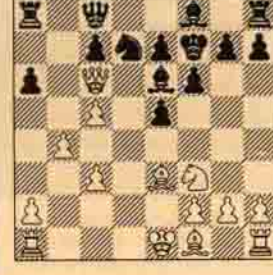
VII. Beyaz oynar kazanır.