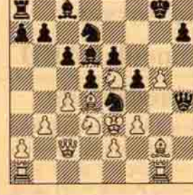
VIII. Siyah oynar kazanır.