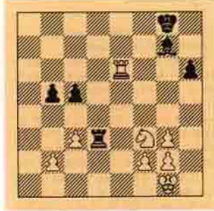
2- Beyaz kazanır