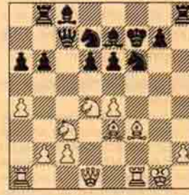
VI. Beyaz oynar kazanır.