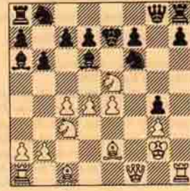
IV. Beyaz oynar kazanır.