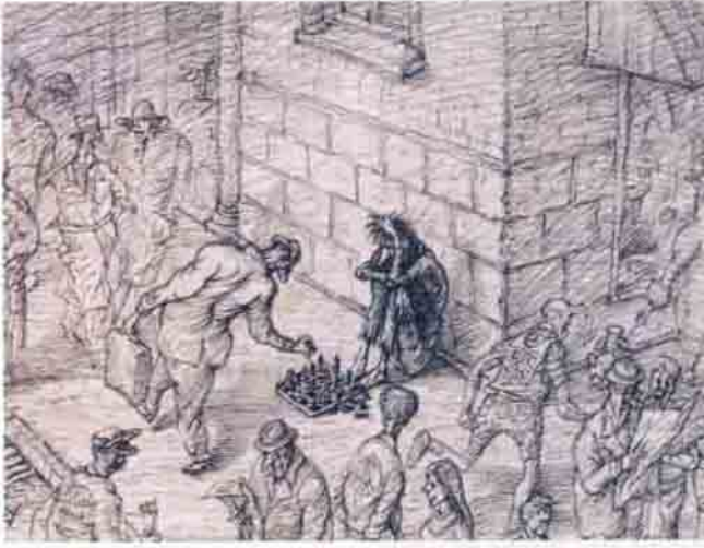
Karpov, Anatoly-Timman, Jan Zwolle 1993 Maçın 12. Oyunu

1. d4 Af6 2. e4 g6 3. Af3 Fg7 4. g3 c6 5. Fg2 d5 6. cd5 cd5 7. Ac3 0-0 8. Ae5 e6 9.0-0 Af7 10. f4 Ac6 11. Fe3 f6 12. Ad3 Ab6 13. b3 Fd7 14. Ff2 Ve7 15. Ke1 Kad8 16. Ke2 Fe8 17. Kd2 Ae8 18. e3 Ad6 19. g4 Şh8 20. Ve2 f5 21. g5 Ae4 22. Ke2 Ab4 23. Ab4 Vb4 24. Kfe1 Fe2 25. Fe1 Ve7 26. Ae4 de4 27. Ff1 Ke8 28. b4 h5 29. Vd2 Vd7 30. Va5 a6 31. Fb4 Kfe8 32. Fe5 Fd5 33. Fb6 Ke2 34. Ke2 Ke8 35. Ke8 Ve8 36. Ve5 Ve5 37. Fe5 Şg8 38. Şf2 Şf7 39. Şe1 Ff8 40. Şd2 Fe7 41. Fe7 Şe7 42. Şc3 a5 43. a3 b6 44. b4 Şd7 45. Fb5 Şd8 46. Fe4 Şe7 47. Fb5 Şd8 48. Fa4 Şe7 49. Fb3 Fe6 50. ba5 ba5 51. Fe4 Şd6 (1/2)