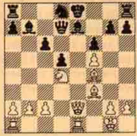
I. Beyaz oynar kazanır.