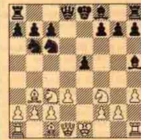
II. Beyaz oynar kazanır.