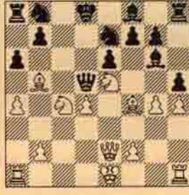
V. Beyaz oynar kazanır.